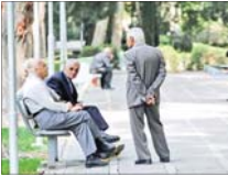
گام بلند برای بازنتیگان تأمین اجتماعی