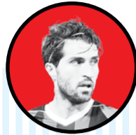
کریم انصاری فرد

میلاذ محمدی در دو جام جهانی ۲۰۱۸ و ۲۰۲۲ یکی از بازیکنان ثابت تیم ملی بود و کارلوس کی‌روش اعتقاد ویژه‌ای به توانایی‌هایش داشت. با این حال و بعد از نیمکت‌نشینی در آ.ا.ک یونان، امیر قلعه‌نویی هم کج‌دار و مرزباز او را به اردو دعوت می‌کند. برای تورنمنت اردن نام میلاذ در لیست هست اما قلعه‌نویی اعتقادی به استفاده از او ندارد.