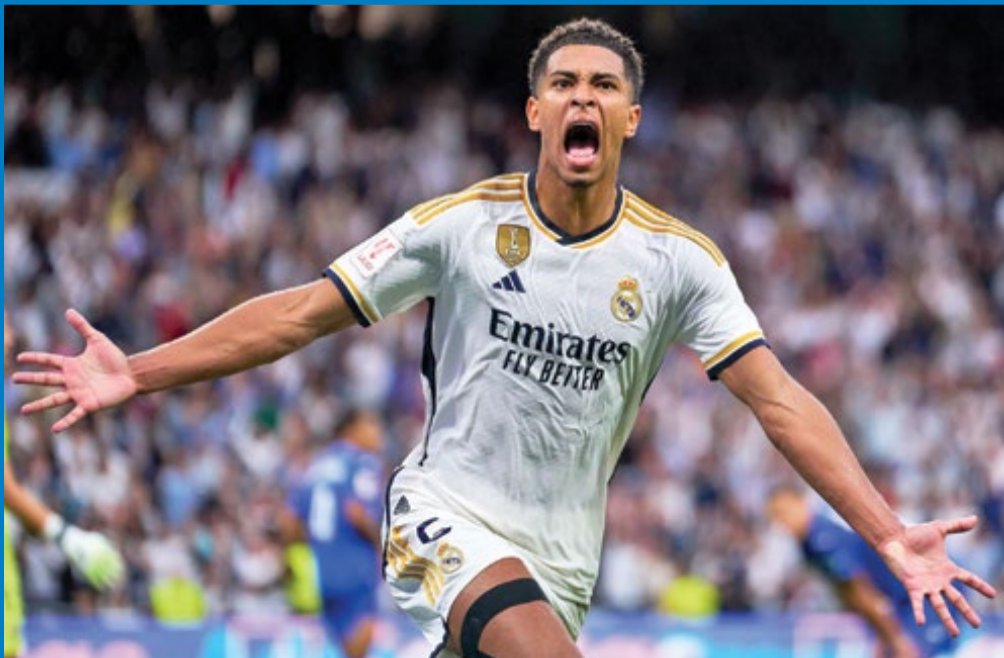
سر می‌برد و به دنبال این است که بتواند با برد مقابل ایتالیا تا حدودی صعود به یورو ۲۰۲۴ را نهایی کند.