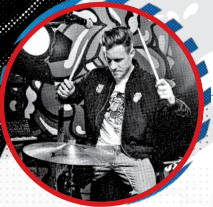
مارک آندره تراشتنگ

ژوانو کانسو در آستانه بازی در اولین آل کلاسیکو دوران فوتبالش قرار دارد. او در مصاحبه‌ای گفت: «این اولین آل کلاسیکو من است و بسیار هیجان‌زده‌ام. بازی در مسابقه‌های بزرگ همیشه هیجان خاص خودش را دارد اما این بازی، با همه بازی‌ها تفاوت دارد. می‌دانیم که مصدوم داریم و با آنها تیم بهتری می‌شدیم اما ما آماده بازی هستیم و برای پیروزی می‌رویم. این مسابقه اهمیت تاریخی دارد و ما برای آن آماده‌ایم.»