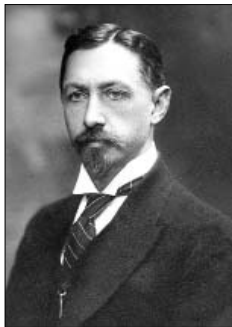
ایوان الکسیویچ بونین

• درگذشت ملا احمد نراقی، دانشمند و مجتهد شیعه، نویسنده و شاعر سده ۱۲ نویسنده (۱۲۰۸ خورشیدی)