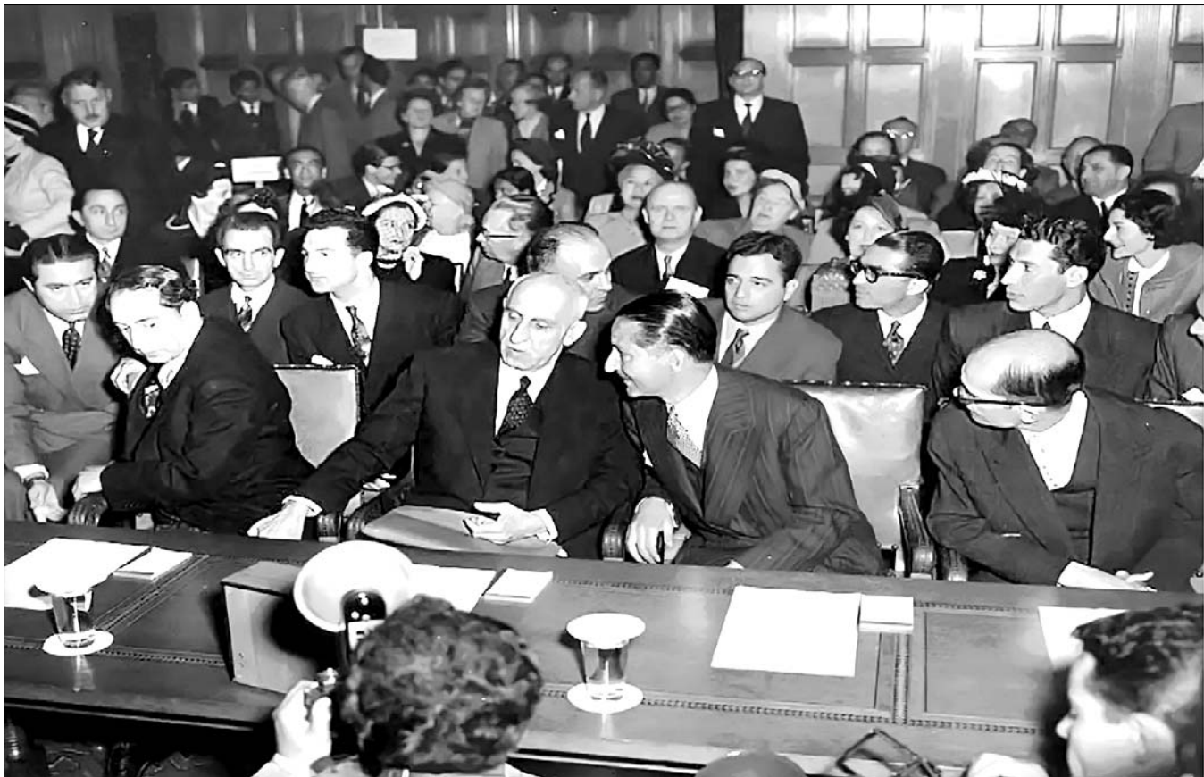
نگار مصطفی در دیوان بین‌المللی دادگستری - ۱۳۳۱