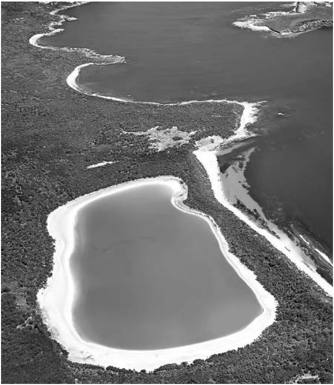
صد در صد پاکیزه

یکی از مناطق زیبای گردشگری در مکران، «دریاچه صورتی» است، البته نام اصلی آن «تالاب لیپار» یا «تالاب صورتی» است اما به «دریاچه صورتی» هم می‌شناسندش. کنار دریای عمان، در مسیر چابهار به گوآتر، دریاچه‌مانندی از ساحل جدا شده. «دریاچه صورتی» در حدود ۵کیلومتری چابهار، بین دو تپه محصور شده است و فاصله چندانی با عمان ندارد؛ شاید صد یا دویست قدم. عده‌ای کبودی این آب را به جهت خاک سرخ منطقه می‌دانند. درواقع می‌گویند چون خاک زیر آب، سرخ است، دریاچه هم صورتی به‌نظر می‌رسد اما کارشناسان اعتقاد دارند این پدیده به جهت فعالیت پلانکتون‌های گیاهی است. تعداد آنها در آذرماه به حداکثر خود می‌رسد و به همین جهت دریاچه در این فصل از سال کبودتر به چشم می‌آید. این پدیده البته به شکلی وسیع‌تر در یکی دیگر از نقاط جهان هم هست. دریاچه‌ای به اسم Retba در سنگال. رنگ صورتی این دریاچه هم به جهت غلظت نمک و ترکیب آن با فعالیت نوع خاصی از باکتری است. این باکتری‌ها در کنار نمک و زیر نور خورشید، چنین رنگی از خودشان متصاعد می‌کنند و منظره‌ای به‌آب می‌دهندکه به چشم‌هر بیننده‌ای خارق‌العاده می‌آید.