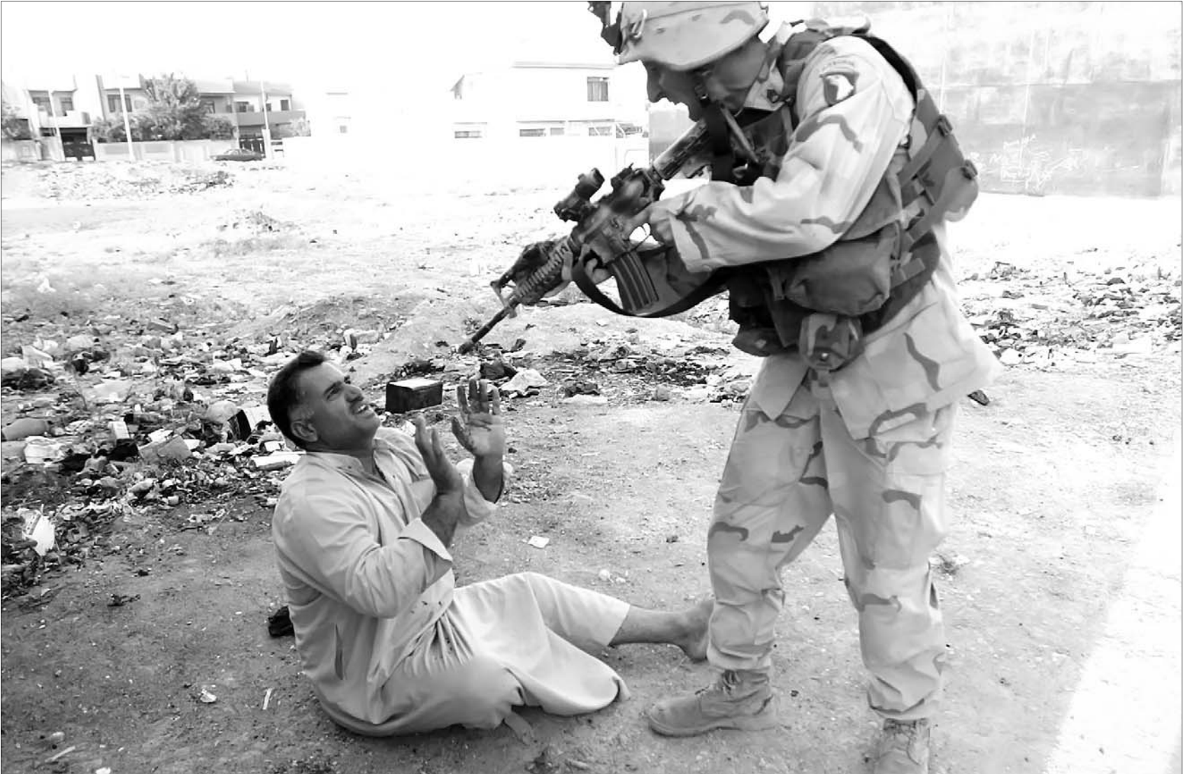
سرباز آمریکایی سلاح خود را به سمت مردی زخمی در موصل عراق در ۲۳ ژوئیه ۲۰۰۳ نشانده گرفته‌استAPI