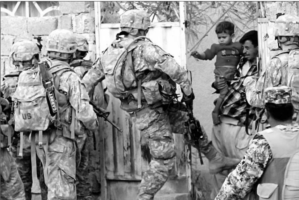
سرباز آمریکایی در حین ماموریت در بعقوبه، در استان دیالی، در حدود ۱۵ کیلومتری شمال شرقی بغداد، ۴ نوامبر ۲۰۰۸ به در خانه‌ای لگد می‌زند.

این گزارش نشان می‌دهد که از پایان جنگ سرد اول در سال ۱۹۹۱، هنگام هژمونی تک‌قطبی ایالات متحده، تعداد مداخلات نظامی واشنگتن در خارج از کشور به‌طور چشمگیری افزایش یافته‌ است. از مجموع ۴۶۹ مداخله نظامی خارجی مستند، دولت آمریکا فقط ۱۱ بار به‌طور رسمی اعلام جنگ کرد. این داده‌ها شامل جنگ استقلال بین ایالات متحده و امپراتوری بریتانیا، هرگونه استقرار نظامی بین سال‌های ۱۷۷۶ تا ۱۷۹۸ و جنگ داخلی ایالات متحده نمی‌شود. مهم است که تأکید کنیم همه این اعداد تخمین‌هایی محافظه‌کارانه هستند، زیرا شامل عملیات‌های ویژه ایالات متحده و