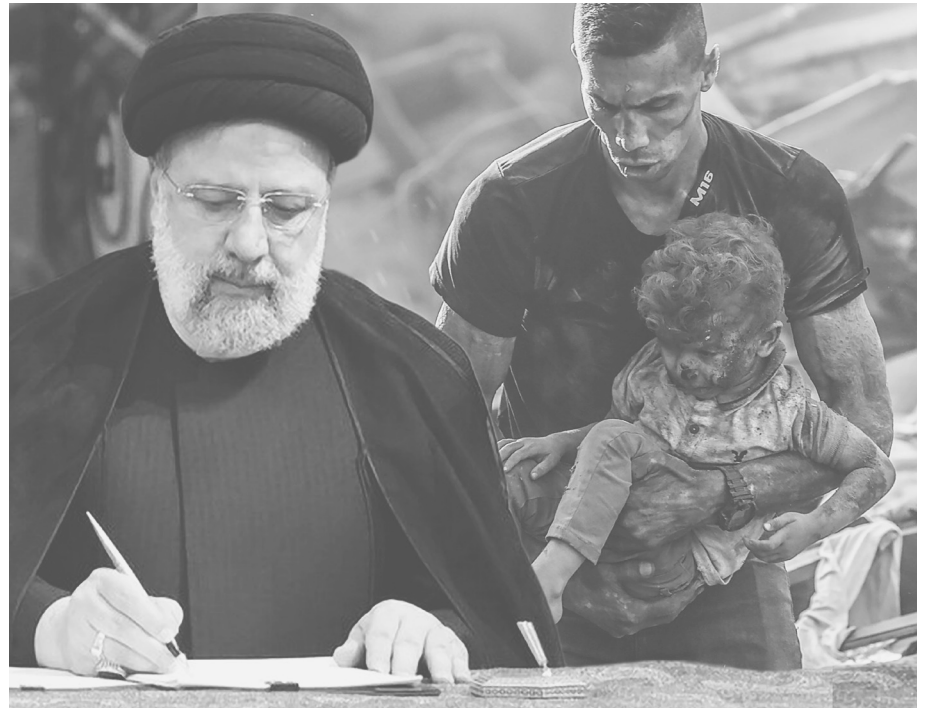
Այսօր Ռեյչսիին քննադատել է Գազայի հատվածում տեղի ունեցող ողբերգական զարգացումների վերաբերյալ Արևմուտքի կիրառած երկակի ստանդարտներն ու լռությունը:

Նախագահը կոչ է արել անկախ երկրներին օգտագործել բոլոր հնարավոր միջոցները՝ ներառյալ Բարայեի հետ համագործակցության դադարեցումը եւ ատենտրային ու քաղաքական կապերի խզումը՝ Գազայի հատվածում յանցագործությունները դադարեցնելու համար: