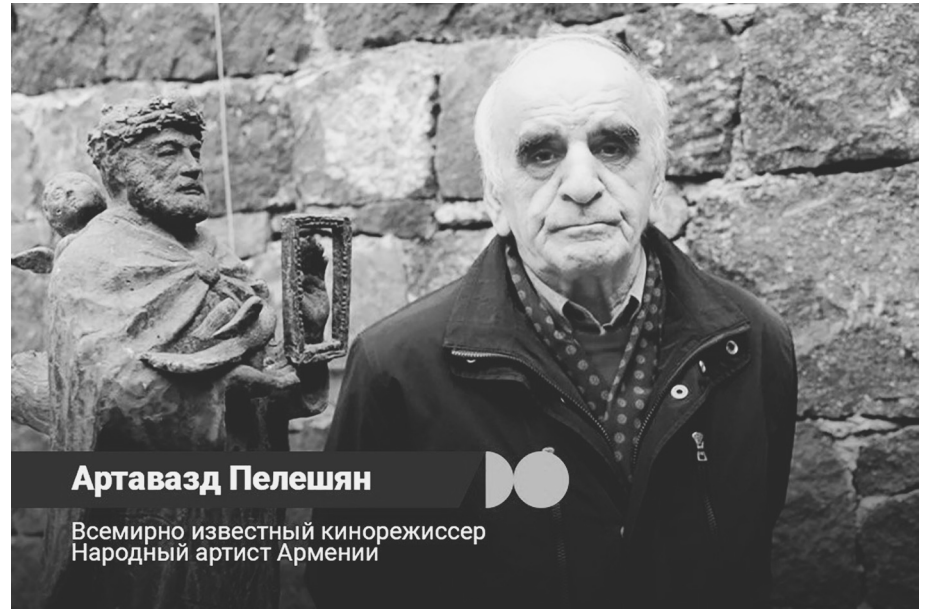
Artavazd Peleshyan Всемирно известный кинорежиссер Народный артист Армении

Արտաւազ Փելեշեանը աշխարհահռչակ կինոնեմոգր է, Հայաստանի ժողովրդական արտիստ, ՌԴ արևեստի վաստակաւոր գործիչ, ՀԽՍՀ Պետական մրցանակի դափնեկիր, բազմաթիւ միջազգային մրցանակների դափնեկիր: Այսպէս կինոգործիչը ծնւել է Գիւմրիում 1938 թ.-ին: Սովորել է Կինեմատոգրաֆիայի համառուսաստանեան պետական ինստիտուտի ռեժիսորական ֆակուլտետում: Դեռ ուսանող ժամանակ Արտաւազը մրցանակների է արժանացել այնպիսի աշխատանքների համար, ինչպիսիք են «Մարդկանց երկիրը» (1966 թ.) եւ «Սկիզբը» (1967 թ.):