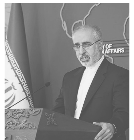
ԱԳՆ պաշտօնական ներկայացուցիչը հաստատիացրել է, որ Իրանն ուշադիր հետեւելու է այդ հարցին:

Քանանին յիշեցրել է, որ ԱԳ նախարար Չուկէն Ամիր Աբոլխանէանը վերջերս ժնեւ կատարած այցի ժամանակ ՄԱԿ-ի ներկայացուցիչների հետ հանդիպմանը բարձրացրել է այդ հարցը: