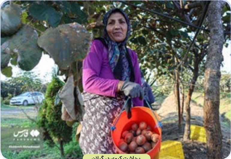
برداشت کیوی در گیلان