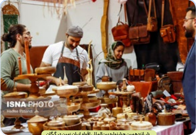
شانزدهمین جشنواره بین‌المللی اقوام ایران زمین در گرگان