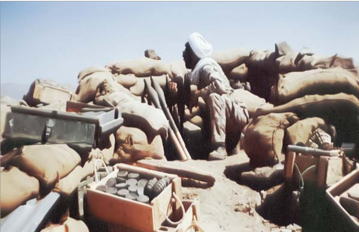
... ادامه از شماره قبل

بعد گفتم: قرآن بخوان. قرآن را باز کرد و به من داد. من باز کردم و دیدم که این آیات آمده است: ﴿و امتازوا لیوم ایها المجرمون﴾ ألم أعهد الیکم یا