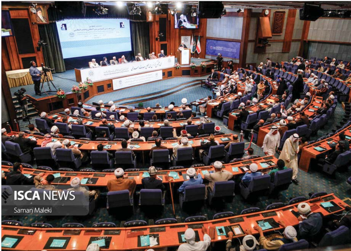
ISCA NEWS Saman Maleki

آیت‌الله العظمی مکارم شیرازی در پیامی به سی و هفتمین کنفرانس بین‌المللی وحدت اسلامی