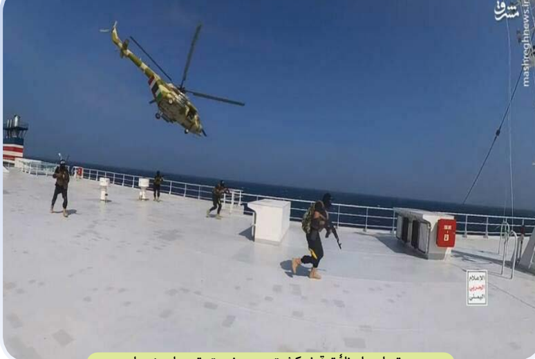
تصاویر لحظهٔ توقیف کشتی صهیونیستی توسط یمنی‌ها