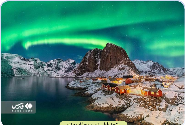
شفق قطبی؛ پدیده جذاب جوی

مثل رسانه هرانا مربوط به حوزه ضد انقلاب ارسال کرده‌اند.