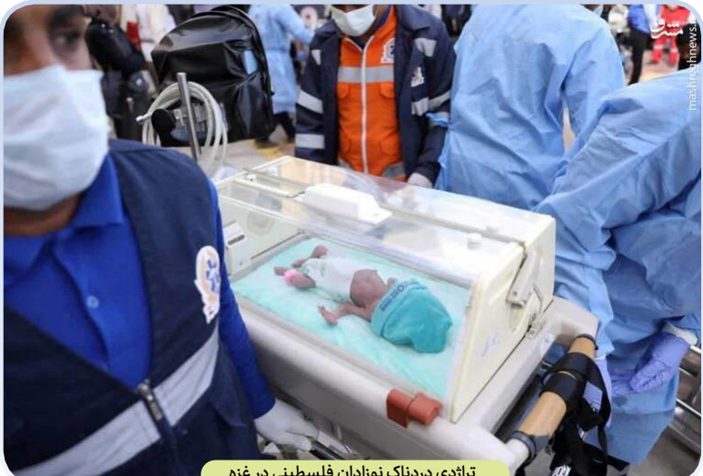
تازدی دردناک نوزادان فلسطینی در غزه