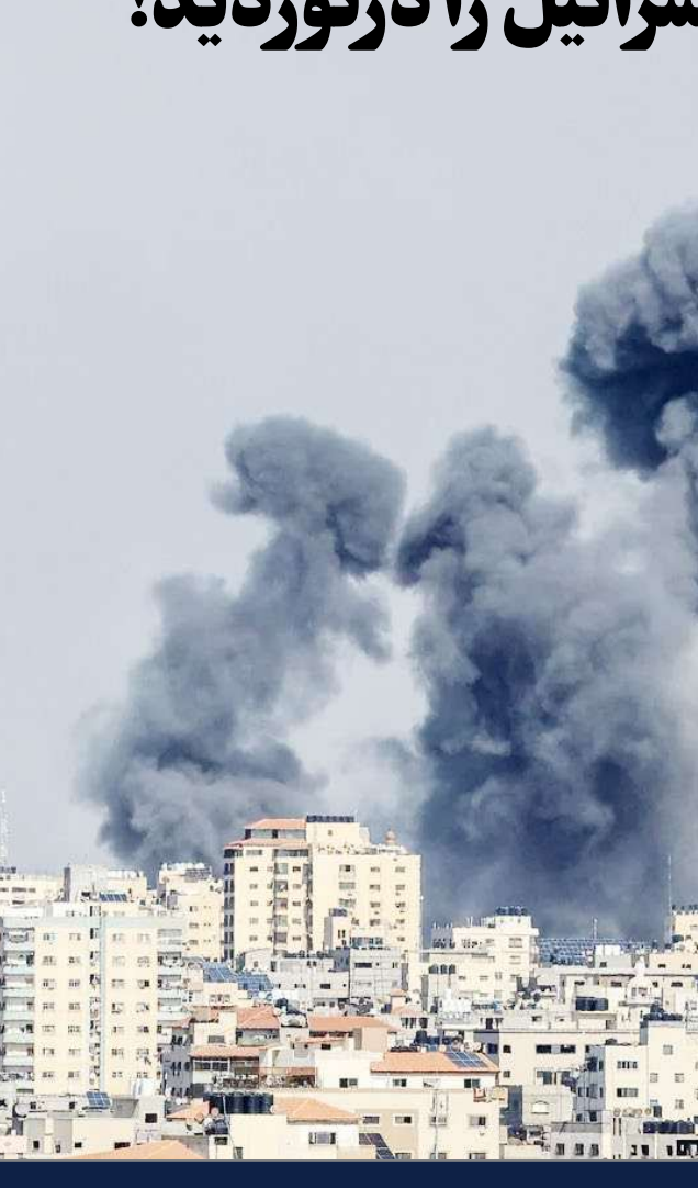
وی افزود: «ضربه اول طوفان الاقصی در چندین موضع دشمن، فرودگاه‌ها و پایگان‌های نظامی آن‌ها را هدف گرفت. از برادرانمان در مقاومت لبنا، ایران، یمن، عراق و سوریه می‌خواهیم به مقاومت بپیوندند. برادرانمان در الجزائر، مراکش، اردن، مصر و باقی جوامع عربی به‌یا خیزند و به باختری نیز گت. «مردم ما در کرانه باختری عملیات خود را علیه شهرک‌های صهیونیست سازمان‌دهی کرده و اشغالگران را درهم شکستند. مردم ما در قدس و به‌یا خاستند و زمین را زیر پای اشغالگران به‌آتش کشیدند. فلسطینی‌ها داخل اراضی اشغالی شمام به باید تفنگ به‌دست بگیردیم. کسی‌که تفنگ ندارد سلاح خرید خرد یا بیرون می‌بازد.» مسئول ستاره داوود سرخ خود اعلام کرد: «تعداد کشته‌های عملیات حماس در غلاف غزه بسیار است و نمی‌توانیم اکنون آزادی ارتکمیم:»؛ این درحالی‌ست‌که ارتش رژیم صهیونیستی در بیانیه‌ای برای حماس خط‌و‌نشان کشیده و گفته که بهای سنگینی پرداخت خواهد کرد. ارتش صهیونیستی در بیانیه‌ای اعلام کرد: «بعد از نفوذ مرزهای شرقی غزه شده است. به‌گزارش شبکه‌های عبری، ده‌ها مبارز فلسطینی از غزه وارد شهرک‌های اطراف غزه موسوم به غلاف غزه شده و دراین شهرک‌ها گشت‌زنی کرده و به با نظامیان صهیونیست درگیر شدند. رسانه متعلق به گردان‌های القسام نیز تصاویری از نفوذ نیروهای ویژه مقاومت فلسطن به پایگاه‌های صهیونیستی رژیم و به‌حلاکت‌رسیدن نظامیان آن منتشر کرد. راديو رژیم صهیونیستی گزارش داد که مبارزان فلسطینی وایسته به حماس وارد مرکز پلیس رژیم صهیونیستی در سدیروت و تعدادی در آنجا زخمی شده‌اند. خبرنگار الجزیره می‌گوید: نیروهای مقاومت بر این مرکز پلیس مسلط شده‌اند، یک شهرک‌نشین به رسانه‌های عبری گفت: ده‌ها نیروی مقاومت در شهرک سدیروت هستند. طبق گزارش دیگری، رئیس پلیس منطقه جنوبی سدیروت به‌ضرب گلوله نیروهای مقاومت زخمی شد. طبق گزارش‌ها، اعضای مقاومت موفق شده‌اند چندین خودروی پلیس را تحت‌کنترل درآورده و به غزه منتقل کنند. رسانه‌ها می‌گویند تا عصر دیروز هیچ کنترلی بر وضعیت غلاف غزه نداشته‌اند. طبق گزارش