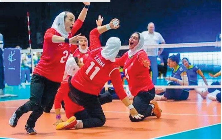
دیدار تیم ملی والیبال نشسته ایران در مقابل تیم روسیه در مسابقات لیگ جهانی

پایان تصریح می‌کند: از کسانی که تلاش کردند تا جلسه دیدار بارهبری برگزار شود، تشکر می‌کنم؛ چرا که این دیدار سعادتی بزرگی است. از کسانی که توان یابان را به نوعی نگاه می‌کنند که آن‌ها قدر مند هستند و طوری نیستند که ضعیف باشند، تشکر می‌کنم. این ورزشکاران واقعا به دنبال بالا بردن پرچم کشور عزیزمان هستند و در نهایت از مسئولان می‌خواهم که به وعده‌هایی که به توان یابان داده می‌شود، عمل کنند.