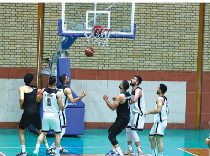
بازی بسکتبال تیم رعد خراسان در مقابل تیم سوسان در لیگ دسته یک

مسابقات زنگ تفريح ديگر تیم‌ها نباشد و از اعتبار بسکتبال استان دفاع کنند. این تیم سوم جدول امتیاز فاصله دارد که اگر کمی تمرکز لازم و انگیزه بالا داشته باشد می‌تواند خود را به میانه‌های جدول