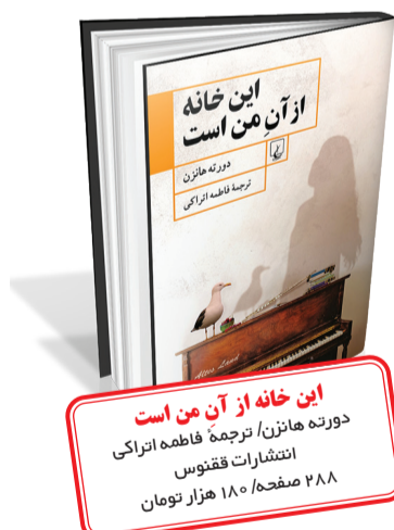
این خانه از آن من است دوره هانزن، ترجمه فاطمه انزلی انتشارات ققنوس ۲۸۸ صفحه / ۱۸۰ هزار تومان

این خانه از آن من است دوره هانزن روایتی زنانه از جنگ و مهاجرت است