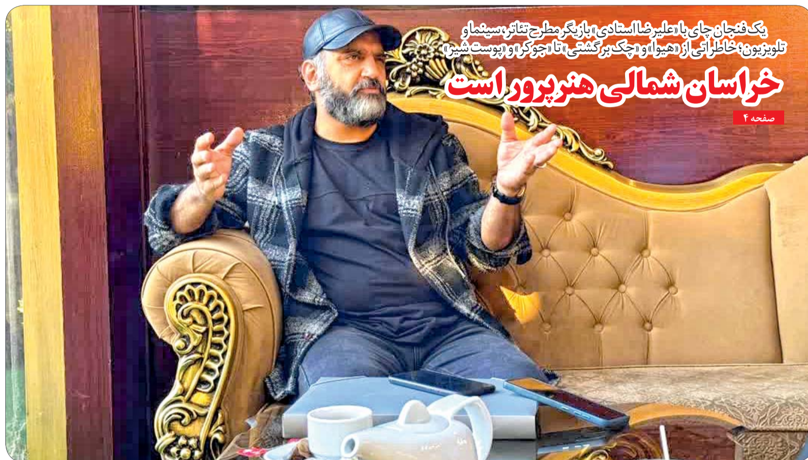
یک فئوجان چای با علیرضا استادی بازیگر مطرح تئاتر، سینما و تلویزیون؛ خاطراتی از «هیوا» و «چک برگشتی» تا «جوکر» و «پوست شین» خراسان شمالی هنرپرور است