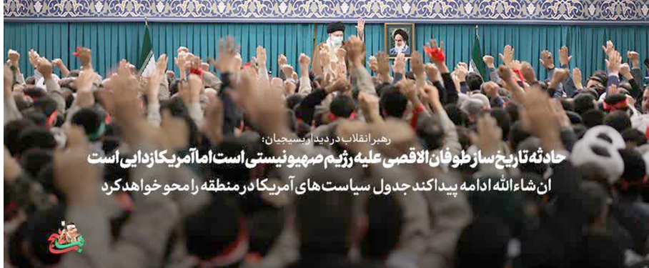
رهبر انقلاب در دیدار از بسیجیان: حادثه تاریخ ساز طوفان الاقصی علیه رژیم صهیونیستی است اما آمریکادایی است ان شاء الله ادامه پیدا کند جدول سیاست های آمریکا در منطقه را محو خواهد کرد.

گفتند میخواهند این منطقه را که اسمش را گذاشتند خاورمیانه یک نقشه ی جدیدی به این بدهند خاورمیانه ی جدید یعنی یک نقشه ی جغرافیای سیاسی نوبی بدهند بر چه اساس؛ بر اساس تأمین نیازها و منافع نامشروع آمریکا. آنی که آنها میخواهند البته اتفاق نیفتاد آنی که آنها دنبالش بودند اتفاق نیفتاد. آنها خواستند حزب الله را نابود کنند در نقشه ی جدیدی که داشتند یکی اش این بود نابودی حزب الله، حزب الله ۱۰ برابر قوی تر شد.