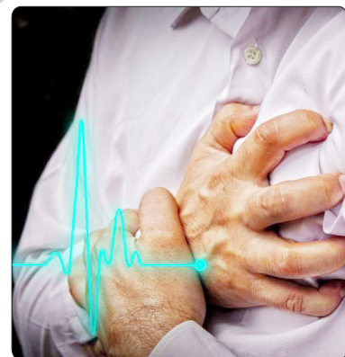
بیماریهای غیر واگیر بیشترین علت مرگ و میر در کشور