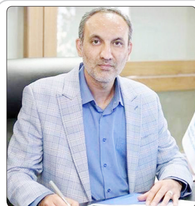
بیمه حوادث کولبران طراحی می شود