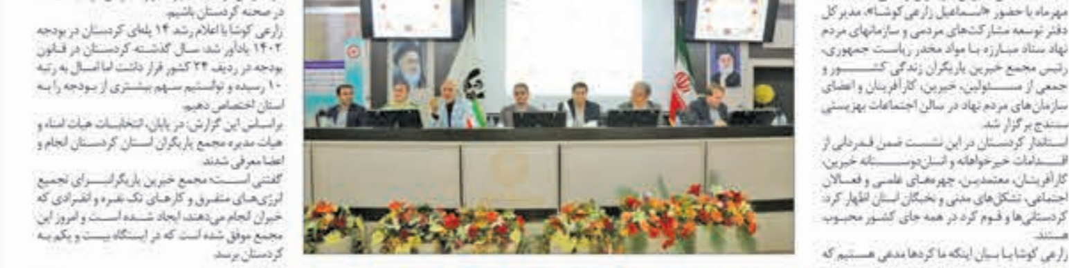
استاندار کردستان در حرکت خود جوش و تجم اعتراضی مردمی در حکومت جناب اسرائیل عنوان کرد:

مجلسه عرض شده است و با اشاره به فرمایش مقام معظم رهبری در توصیف علوم کرد افزود: قسم کرد یکی از پشترترین قوم هستند. او با اشاره به ظرفیت‌ها و مویست‌های خدادادی در استان کردستان و عنایت ویژه خدایند به این منطقه هفتاد سال سابقه دارد، ادامه داد: کردستان، استانی مستعد و سرشار از ظرفیت‌های بی‌نظیری است و ما مخالف و راه محروم برای این دیار با زمین‌های بالای طبیعی هستیم اما به دلایل مختلف محروم‌تری بر این