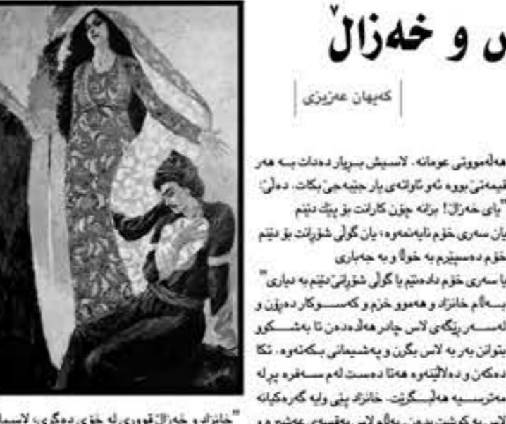
د کورتهیهک له بهیته لاس و خهزال و چهند سهرنج...