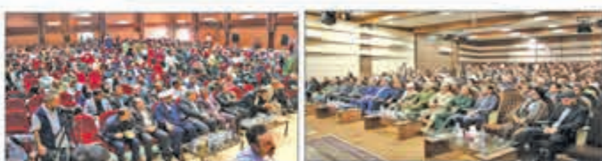
استاندار کردستان در اختتامیه شازدهمین جشنواره بین‌المللی تئاتر خیابانی میروان:

پیش‌بینی کردند، سه‌هفته‌ایست که ۲۵ سال آینده را نخواهد دید. و به موجودیت پایدار استان خاتمه داده خواهد شد. رازی کوشا کشتزار سی رحمتله زنان و کودکان فلسطینی که سالهاست در محرومیت و شرایط بسیار سختی زندگی می‌کنند و حمله رژیم غاصب به بیامستان غزه را نشان از دست و پا زدن‌های آخر و سقوط حسی رژیم غاصب عنوان کرد و گفت امروز این اجتماع متعدده و حضور مومنانه اعلام حمایت از مردم غریز فلسطین و غزه است و هم اعلام آمادگی بسیاری پایان دادن به این جرم‌نامه پلید و همچنین ادای یک تکلیف بزرگ است.