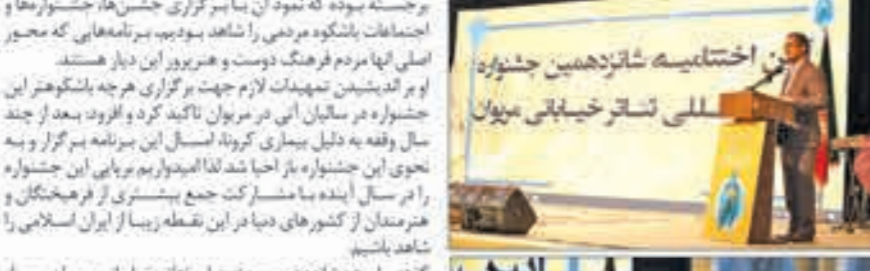
استاندار کردستان گفت: به لطف ظرفیت‌های کم‌نظیر و بی‌تصیب هستند، هنرمدانی که نسل ما و نسل قبل و بعد از ما بر سر سفره هنرشان منتهم بودند.

هنرمندان برجسته بی‌تصیب هستند، هنرمدانی که نسل ما و نسل قبل و بعد از ما بر سر سفره هنرشان منتهم بودند. وی با بیان اینکه استان کردستان به لطف ظرفیت‌های کم‌نظیر و بی‌بدیل، امروز به سرزمین جشن‌ها و جشنواره‌ها تبدیل شده است. افزود: ما بسیار متفخر و خوشحالیم که اهل این دیار و خاتم میروان را به عنوان کانون جشن‌ها و جشنواره‌ها در نظر بگیریم. افزود: ما بسیار متفخر و خوشحالیم که اهل این دیار و خاتم میروان را به عنوان کانون جشن‌ها و جشنواره‌ها در نظر بگیریم.