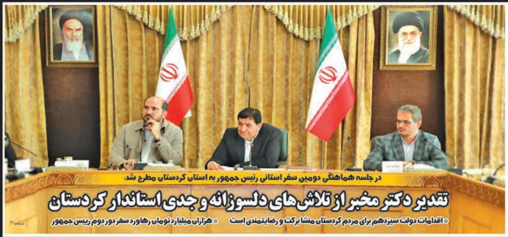
در جلسه هماهنگی دومین سفر استانی رئیس جمهور به استان کردستان مطرح شد: