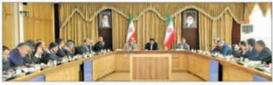
در جلسه هماهنگی دومین سفر استانی رئیس جمهور به استان کردستان مطرح شد: