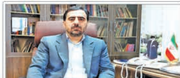
۱۵۱ داوطلب نمایندگی مجلس دوازدهم در کردستان ثبت نام نهایی کردند

نشانی الکترونیکی: Govarisirwan@gmail.com سیروان در فضای مجازی: @Sirwan_weekly / شماره ۱۲۵۲ / سال بیست و پنجم / ۸ صفحه / ۲۰۰۰۰ ریال / شنبه ۶ آبان / ۱۲ ربیع الثانی ۱۴۴۵ / ۲۸ اکتبر ۲۰۲۳ / شماره ۱۲۵۲ / سال بیست و پنجم / ۸ صفحه / ۲۰۰۰۰ ریال