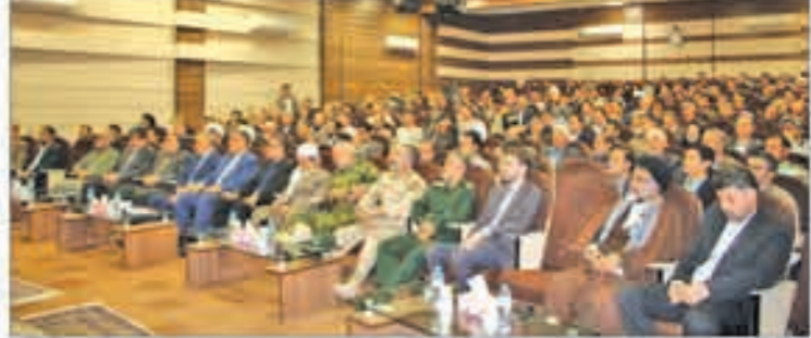
آیو افزود: میزبانی از زائرین اربعین حسینی (ع) و افتخاری که نصیب ما شده در این استان، فرصت ارزشمندی است که باید در جهت خدمت‌رسانی و توسعه‌ی این استان به کار گرفته شود.

استاندار کردستان با اشاره به اینکه تکمیل این مسیر یک امر پیروزانه و راهبردی است و ترازوی موفقیت کشور را در تحقق این مسیر می‌داند، افزود: در سفر اخیر به کوشا، دیدار با مسئولان و کارکنان کوشا با هدف تبادل نظر و اشتیاق از این فرصت استقبال کردند و نتایج حاصل از این دیدار را در زمینه نتایج بسیار خوبی حاصل شده است.