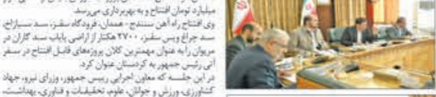
محمّد محبو در این جلسه با اشاره به تکمیل و ساماندهی طرح‌های عمری اجرای طرح‌های عمری و زیرساختی و همچنین افتتاح و بهره‌برداری از پروژه‌های نیمه‌تمام ریلی استان کردستان و طرح‌های آموزشی، مسافری و تفریحی خفته در سفر رئیس‌جمهور به این استان، تلاش‌ها و خدمات مدیریت اجرایی رئیس‌جمهور و استاندار کردستان در پیگیری‌های جدی و

دلسوزانه مصوبات سفرهای استانی فدرالی و تاکید کرد اقدامات تمام‌جانبه‌ای را در راستای توسعه استان و رفاه مردم کردستان در نظر گرفته است. دکتر مخبر در این سفر استانی، با حضور معاون اول رئیس جمهور و جمعی از وزرا و رؤسای سازمان‌ها جمع بندی موضوعات و تعیین تکلیف برای اقدامات فوری در راستای توسعه استان کردستان را در نظر گرفت. دکتر مخبر در این سفر استانی، با حضور معاون اول رئیس جمهور و جمعی از وزرا و رؤسای سازمان‌ها جمع بندی موضوعات و تعیین تکلیف برای اقدامات فوری در راستای توسعه استان کردستان را در نظر گرفت.