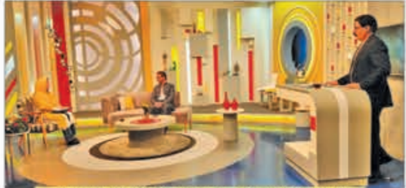
نویید استاندار کردستان با حضور در برنامه زنده شبکه جهانی سحر: