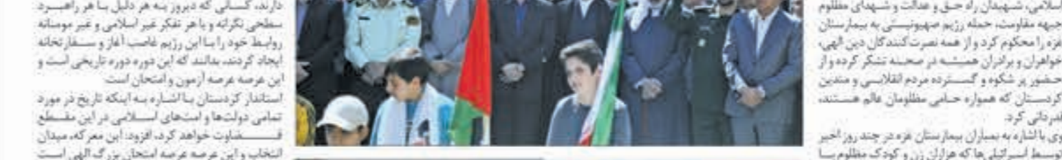
استاندار کردستان در حرکت خود جوش و تجم اعتراضی مردمی در حکومت جناب اسرائیل عنوان کرد:

استاندار کردستان، خروش و فرجام مردم‌استان در حکومت جناب اسرائیل را در هم شکست. او با اشاره به فرمایش مقام معظم رهبری در توصیف علوم کرد افزود: قسم کرد یکی از پشترترین قوم هستند. او با اشاره به ظرفیت‌ها و مویست‌های خدادادی در استان کردستان و عنایت ویژه خدایند به این منطقه هفتاد سال سابقه دارد، ادامه داد: کردستان، استانی مستعد و سرشار از ظرفیت‌های بی‌نظیری است و ما مخالف و راه محروم برای این دیار با زمین‌های بالای طبیعی هستیم اما به دلایل مختلف محروم‌تری بر این