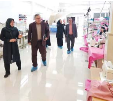
را همراهی کردند و در روند فعالیت های موسسه مینو قرار گرفتند.