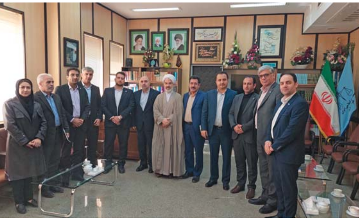
بررسی راهکارهای گسترش تعاملات شرکت های بیمه با دستگاه قضایی