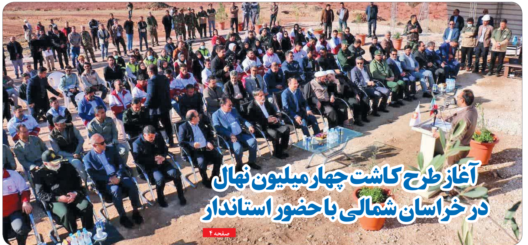
آغاز طرح کاشت چهار میلیون نهال در خراسان شمالی با حضور استاندار