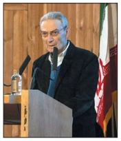
دنیای اقتصاد: محمدرضا جودت، معمار پیشکسوت ایرانی و یکی از بنیانگذاران معماران مدرن ایران، پنج‌شنبه گذشته نهم آذرماه در ۸۴سالگی درگذشت. محمدرضا جودت در سال ۱۳۱۸ در اردبیل متولد شد. پس از گذراندن دوره ابتدایی و دبیرستان در سال ۱۳۴۰ در دانشکده هنرهای زیبای دانشگاه تهران رشته نقاشی را ناتمام رها کرد و در رشته معماری و شهرسازی دانشگاه شهید بهشتی با مدرک فوق لیسانس فارغ‌التحصیل شد. جودت طراحی و مدیریت پروژه‌های گوناگون از جمله طراحی معماری دانشکده‌های پزشکی و پیراپزشکی سمنان و صنعت و سالن آمفی تئاتر بندرعباس را در کارنامه خود دارد. تالیف کتاب‌های بررسی هنری اجتماعی امپرسیونیسم، معماری قدیم و جدید ژاپن و ترجمه کتاب‌هایی چون ریشه‌های معماری مدرن، معماری دیکاناستراکشن، معماری و دیکاناستراکتیویست، پایان هنر، زهدان‌های معماری، تو معمار را ترسیم می‌کنی ولی من آن را می‌سازم از جمله آثار این معمار فقید است.