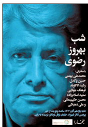
شب بهروز رضوی پیشکشوت رادیو است که از دهه چهل تا کنون به عنوان گوینده رادیو مشغول به کار بوده است. او همچنین در ترانه‌سرایی هم دست به قلم دارد. بسیاری از کتاب‌های شناخته شده با صدای این گوینده پیشکشوت از رادیو پخش شده است. شب بهروز رضوی پس از برگزاری «شب آناه ماری شیمل» که هفته قبل در پردیس شهرزاد برگزار شد، در ساعت پنج بعدازظهر شنبه یازدهم آذرماه ۱۴۰۲ در پردیس تئاتر شهرزاد به نشانی خیابان حافظ، نوفل لوشاتو، بعد از سفارت ایتالیا، شماره ۷۴ برگزار می‌شود.