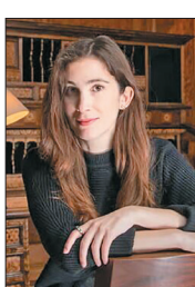
دنیای اقتصاد: «موجودات غیرممکن» نوشته کاترین رندل به عنوان کتاب سال جایزه ادبی «واتراستونز» سال ۲۰۲۳ معرفی شد. این رمان ادبیات کودک، داستان مجمع‌الجزایری را روایت می‌کند که در آن موجودات جادویی زندگی می‌کنند. علاوه بر «موجودات غیرممکن»، کتاب «برای یادبود» نوشته الیس وین عنوان «رمان سال واتراستونز» را به خود اختصاص داد. وین در ماه اوت جایزه بهترین نویسنده رمان اولی واتراستونز را دریافت کرده بود. راندل تاکنون کتاب‌های متعددی برای کودکان به نگارش درآورده است که در جمله آنها می‌توان به «هشت‌ماهه» اشاره کرد که در سال ۲۰۱۴ برنده جایزه بهترین کتاب کودک واتراستونز شد. این نویسنده همچنین کتاب‌های غیرداستانی را برای مخاطب بزرگسال منتشر کرده است.