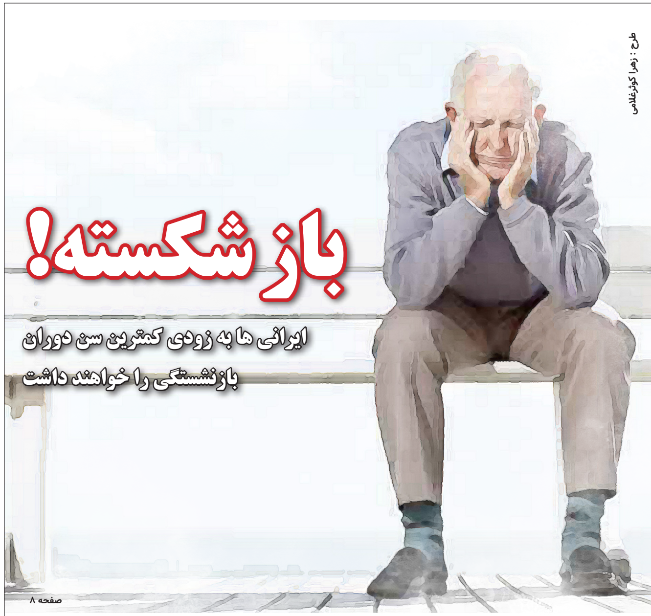
طرح : زهرا کوشکوری غلامی