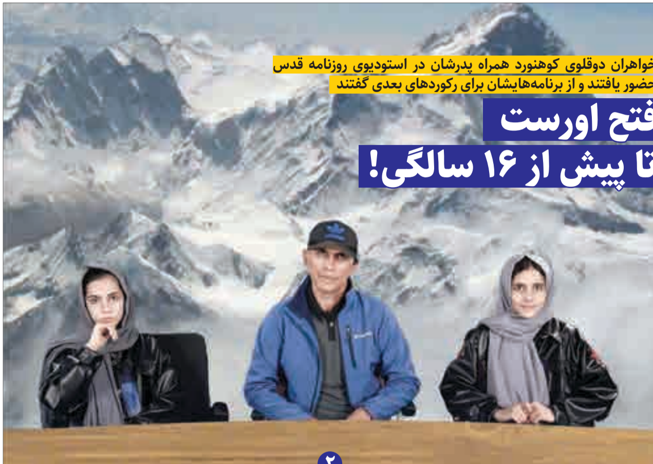
خواهران دولوی کوهنورد همراه پدرشان در استودیوی روزنامه قدس حضور یافتند و از برنامه‌هایشان برای رکوردهای بعدی گفتند