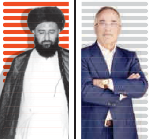
واعظ آشتیانی در گفت و گو با مجله تصویری قدس (میدان): فدراسیون هنوز پول ویلموتس را نداده است