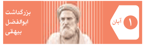
بزرگداشت ابوالفضل بیهقی