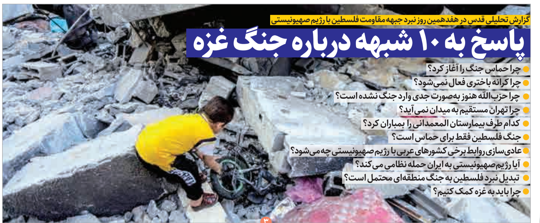
گزارش تحلیلی قدس در هفدهمین روز نبرد جبهه مقاومت فلسطین با رژیم صهیونیستی