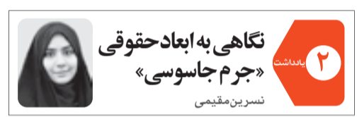
نگاهی به ابعاد حقوقی «جرم جاسوسی» نسرین مقیمی