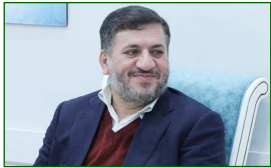
استاندار یزد :

سرمایه‌های اجتماعی مرکز وکلا مردم هستند که در این راستا نیز مرکز وکلا مردمی عمل کرده است