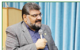
رئیس مرکز وکلا:

سرمایه‌های اجتماعی مرکز وکلا مردم هستند که در این راستا نیز مرکز وکلا مردمی عمل کرده است