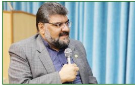
رئیس مرکز وکلا:

سرمایه‌های اجتماعی مرکز وکلا مردم هستند که در این راستا نیز مرکز وکلا مردمی عمل کرده است