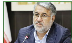
رئیس کل دادگستری یزد:

هدف همه ما و دستگاه قضایی صیانت و حمایت از حقوق افراد جامعه است