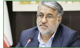
رئیس کل دادگستری یزد :

هدف همه ما و دستگاه قضایی صیانت و حمایت از حقوق افراد جامعه است