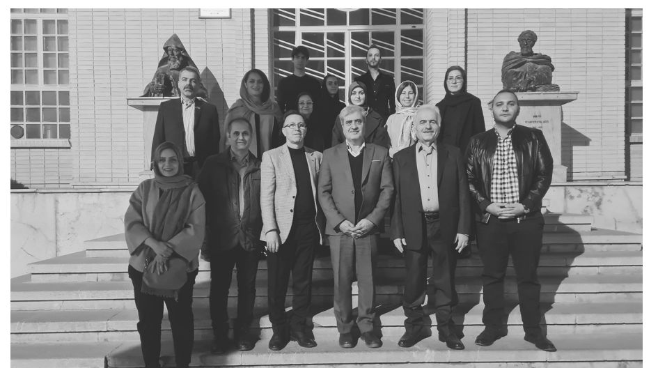
(Շար. 6-րդ էջում)