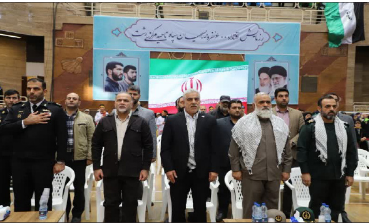
با سخنرانی سردار نقدی معاون هماهنگ کننده سپاه پاسداران بر گزار شد: