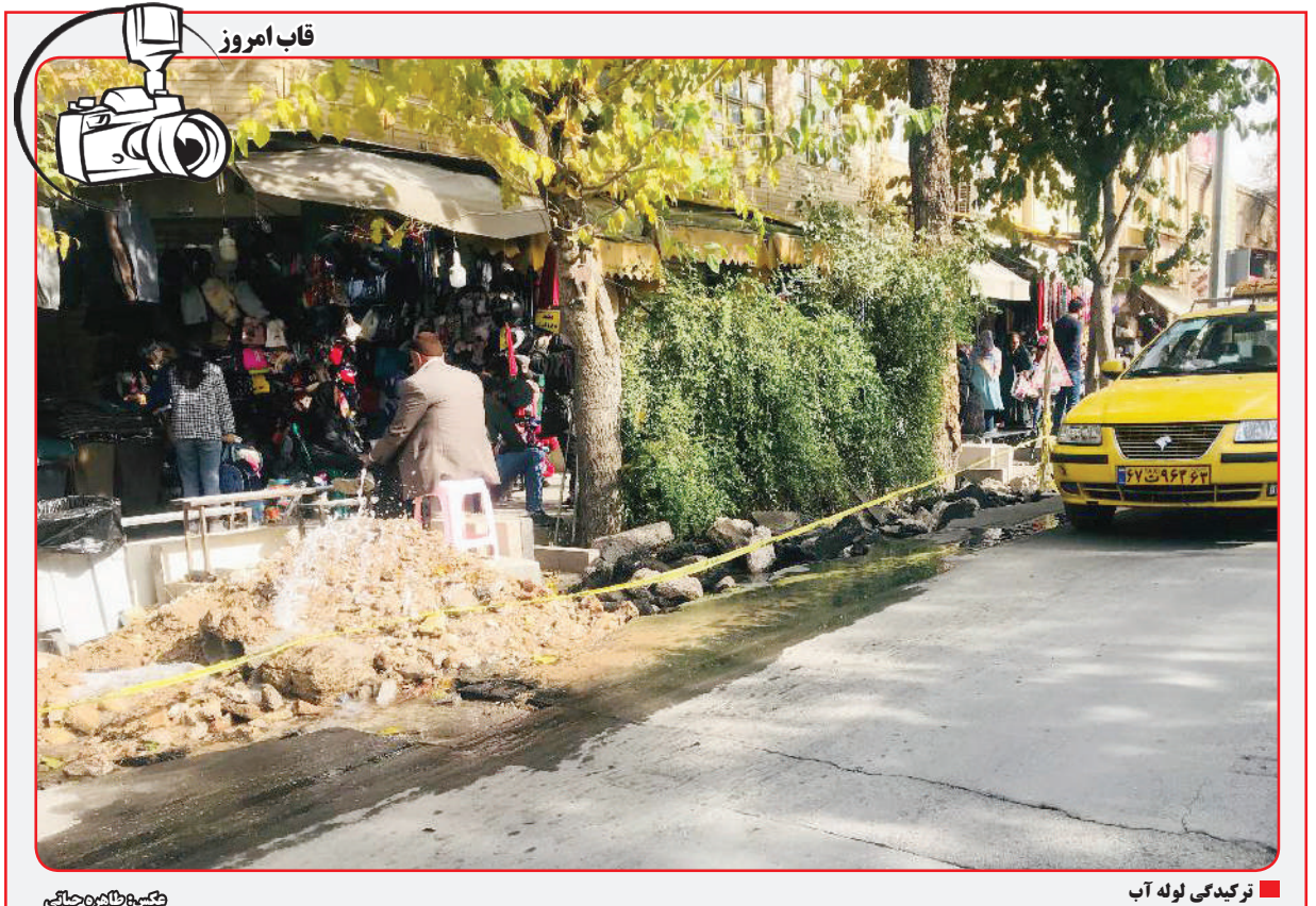
ترکیه کی لوله آب