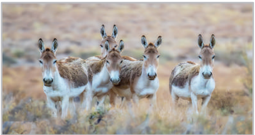
منطقه حفاظت‌شده بهرام گور