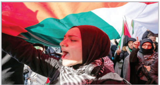
تظاهرات حامیان فلسطین - شهر استانبول ترکیه