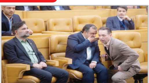
در حاشیه مراسم افتتاح همایش اقتصاد ایران