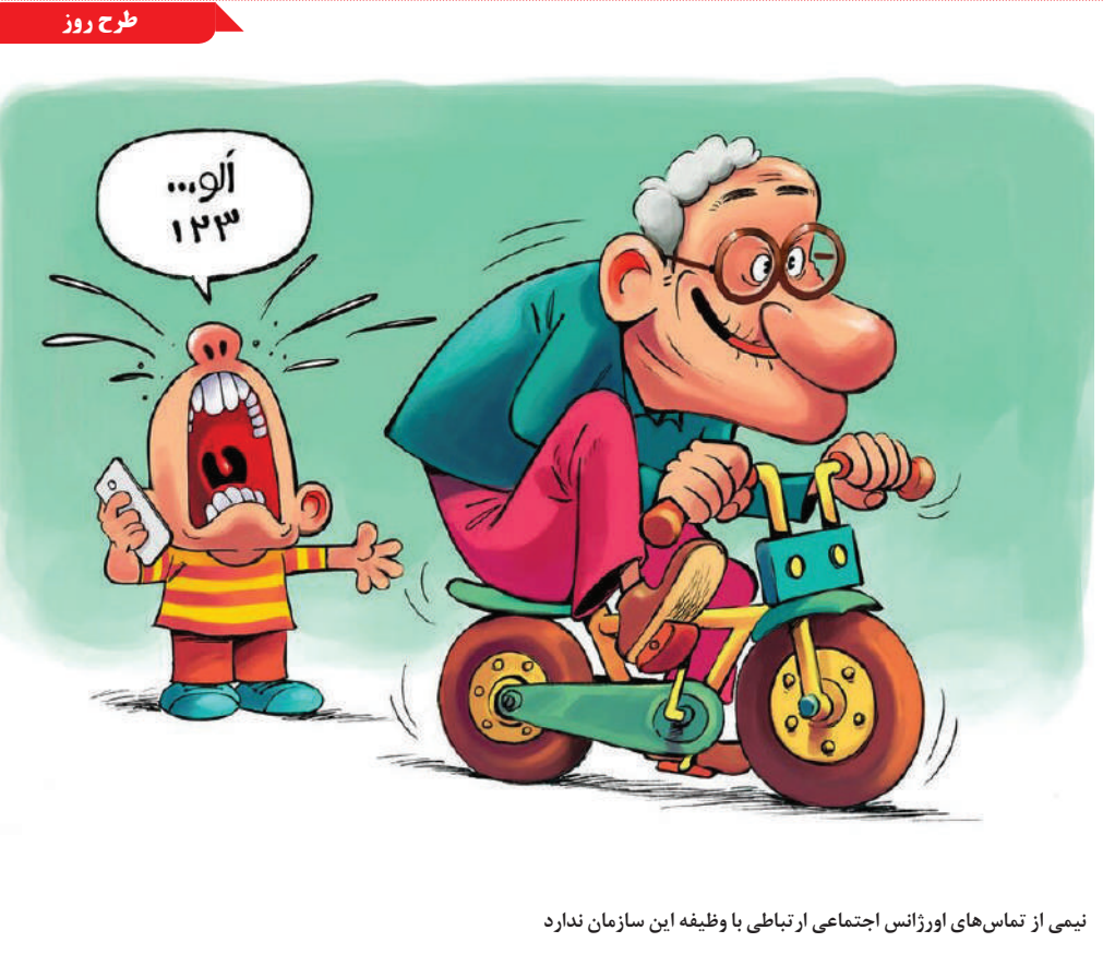
نیمی از تماس‌های اوزانس اجتماعی ارتباطی با وظیفه این سازمان ندارد

منیزیم برای تبدیل غذایی که می‌خوریم به انرژی