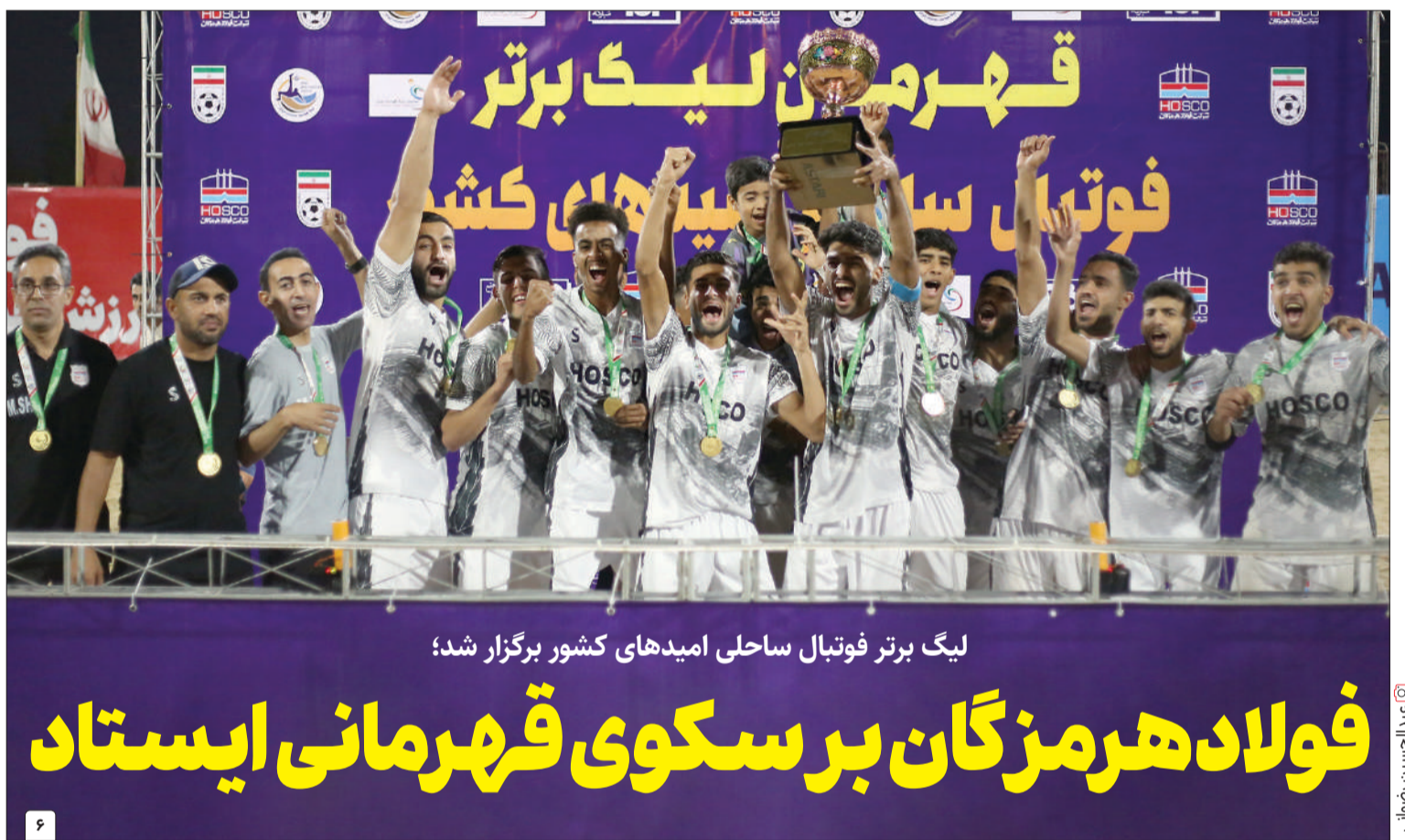
لیگ برتر فوتبال ساحلی امیدهای کشور برگزار شد؛