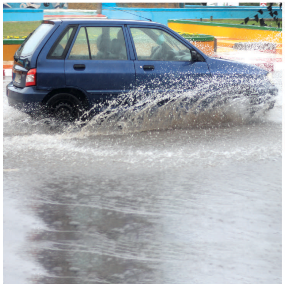
عکس روز | باران های پاییز و زمستان بندرعباس