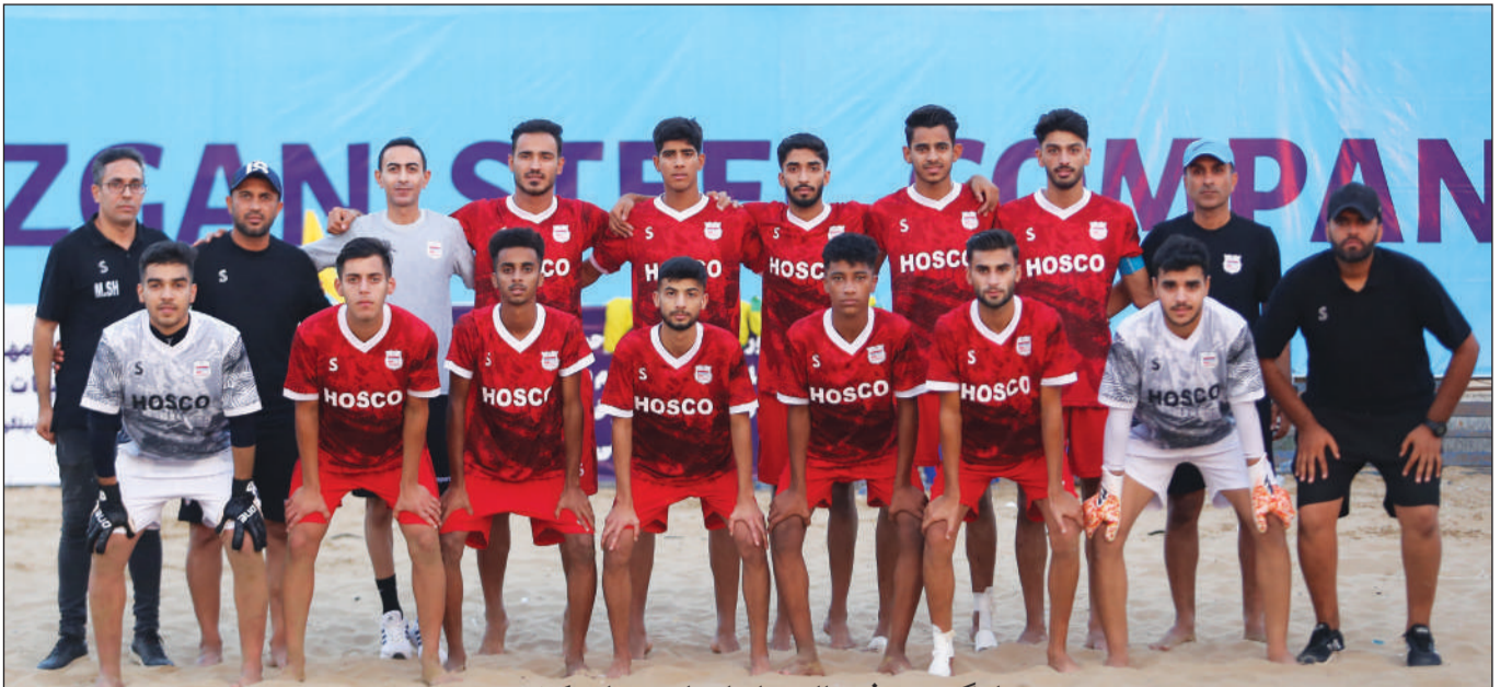
لیگ برتر فوتبال ساحلی امیدهای کشور

با اجرا و راه اندازی پروژه خانه تنیس روی میز در شهرستان بندر خمیر، این سالن به یکی از بهترین و مجهزترین سالن های پینگ پنگ کشور تبدیل شده است.