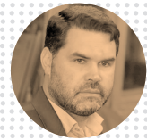
دکتر سینا کلهر

دکترای جامعه‌شناسی فرهنگی و معاون فرهنگی وزیر ورزش