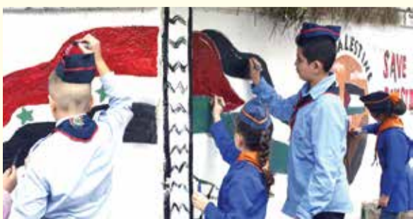
قضايانا ذكرى خالدة تتناقلها الأجيال.