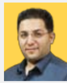
وحدت‌عظیم‌نیا دبیر گروه اقتصاد

لايه بودجه ۱۴۰۳ در حالی تقدیم مجلس شده که یکی از لوايح بودجه با بیشترین میزان اصلاح درآمدهای مالیاتی و تکیه بر افزایش درآمدهای مالیاتی از طریق مبارزه با فرار مالیاتی است. همچنین یکی از مفاهیم کلیدی در زمینه بودجه، بحث میزان تراز بودن بخش عملیاتی بودجه تحت عنوان تراز عملیاتی بودجه است. بدین معنا که درآمدهای پایدار تا چه میزان هزینه‌های پایدار یا مصارف جاری دولت را پوشش می‌دهند. در اقتصادهایی مثل اقتصاد ایران که بودجه دولت وابسته به فروش نفت است، همواره دچار کسری بودجه هستیم. از سال‌ها قبل نیز به دلیل اینکه نفت در بودجه اثرگذار بوده است، همواره شاهد کسری تراز عملیاتی بودیم. در صفحه پیش‌رو به بررسی این موضوع پرداخته‌ایم.