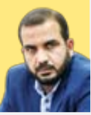
مجتبی یوسفی عضو هیئت رئیسه مجلس