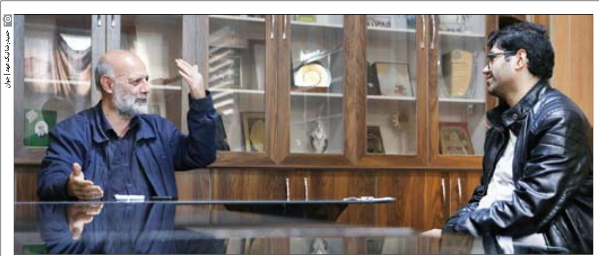
دبیرکل خانه کارگر می‌گوید که این تشکیلات بیش از ۲میلیون۴۰۰هزار عضو دارد که تلاش می‌کنیم آنها را برای مشارکت در انتخابات ترغیب و تشویق کنیم

مسیر تجلی اراده مردم هم صندوق رأی و جمععات قانونی صنفی است. صندوق رأی ابزار اراده مردم است. ما نباید صندوق رأی را کنار بگذاریم، همچنین نباید خیابان و صندوق رأی را مقابل هم تعریف کنیم. خیابان همواره در جمهوری اسلامی به نفع نظام بوده است و می‌تواند محل تجلی اراده مردم باشد.