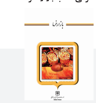
مشخصات کتاب الکترونیک