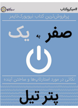
مشخصات کتاب الکترونیک

مطالعه همه جانبه این بازار و شناخت مولفه‌های مهم آن و نیز تنظیم دولت و نهادهای تولیدکنندگان، مصرف‌کنندگان، دولت‌ها سیاست‌هایی را در بازار این محصول به اجرا گذارد.