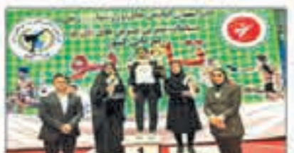
گزارش از عادل خلیان

تیم رزمی کاران دختر گردستان در رقابت های قهرمانی های سو کشور موفق به کسب ۱۶ مدال رنگارنگ و عنوان نایب قهرمانی شدند. مسابقات بانوان گروه نای پوی قهرمانی کشور در بخش بانوان و در چهار رده سنی، با حضور ۲۰۰ شرکت کننده از ۱۴ استان طی روز های دوم و سوم آذر ماه به میزبانی شهر بوکان در استان آذربایجان غربی و در گزار شد. تیم رزمی دختران استان گردستان در این مسابقات با کسب ۱۶ مدال طلا، نقره و برنز جایز نایب قهرمانی این دوره از رقابت ها را به خود اختصاص داد. کوردستانی را در رده مس گرفته مسز ۲ نشان نقره و در میان تمامی کوردستانی ها کورد چپ یک مدال طلا و دو مدال نقره و دو نشان برنز را کسب کردند. همچنین دو در رده سنی نوجوانان بانوان کوردستانی دو طلا، یک نقره و دو سوز را به خود اختصاص دادند و در رده سنی نوجوانان نیز صاحب یک نشان طلا و دو برنز شدند.