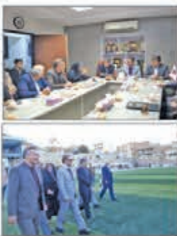
گزارش از عادل خلیان

استاندار گردستان حمایت از حضور ورزش را کمک به توسعه استان دانست و گفت: جامعه ما نیازمند توجه به ورزش برای بسوی رفت از آسب های اجتماعی و لیل جوانان و آینده سازان استان به است آبیتر ورزشی است. استاندار اظهار داشت: همراهی همه با حسی از مدبران، روز پنجشنبه نهم آذر ماه ضمن بازدید از باشگاه فرهنگی ورزشی آبیتر سنجح، در جریان بازدید از ورزشکاران و امکانات رفاهی ورزشی این باشگاه قرار گرفت و با حضور در جمع بازیکنان و کادر فنی، باشگاه با آنان به گفتگو و تبادل نظر پرداخت. استاندار گردستان در جریان این بازدید اظهار کرد: جامعه ما نیازمند توجه به ورزش برای بیرون رفت از آسب های اجتماعی و لیل جوانان و آینده سازان استان به سمت آبیتر ورزشی است. استاندار بیان داشت: ما در حال حاضر با مشکلاتی مواجهیم که نیاز به تلاش و همکاری همه ما دارد. استاندار گفت: ما در حال حاضر با مشکلاتی مواجهیم که نیاز به تلاش و همکاری همه ما دارد.