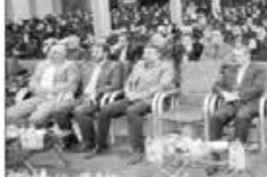
استاندار کردستان در این مراسم ضمن تبریک فرارسیدن روز دانشجو و روز معلمان، بر اهمیت نقش معلمان در تربیت نسل آینده تأکید کرد.

در ارتباطات و حوزه علم و فناوری ای تقویت به سرعت جامعه در حال تغییر و تحول و نیازمند تغییر نظام آموزشی کنونی است. دانشگاه فرهنگیان باید بتواند با بهره گیری از روش های نوین آموزشی، بتواند روش های نوین را در اختیار شما قرار دهد.