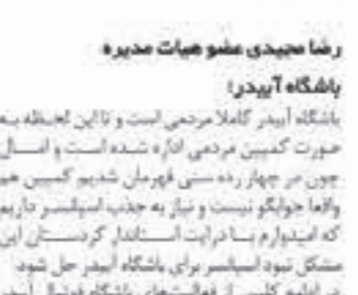
گزارش از عادل خلیان

در دیدار استاندار و معاون عمرانی استانداری در جمع آبیتری ها چه گذشت؟ روز پنجشنبه ۹ آذر وقتی استاندار محترم و معاون عمرانی استانداری در جمع آبیتری ها به باشگاه مردمی آبیتر سنجح آمدند از نزدیک مشکلات این باشگاه فوتبالی را دیدند.