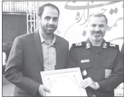
بسیج رسانه بابل در کشور برتر شد