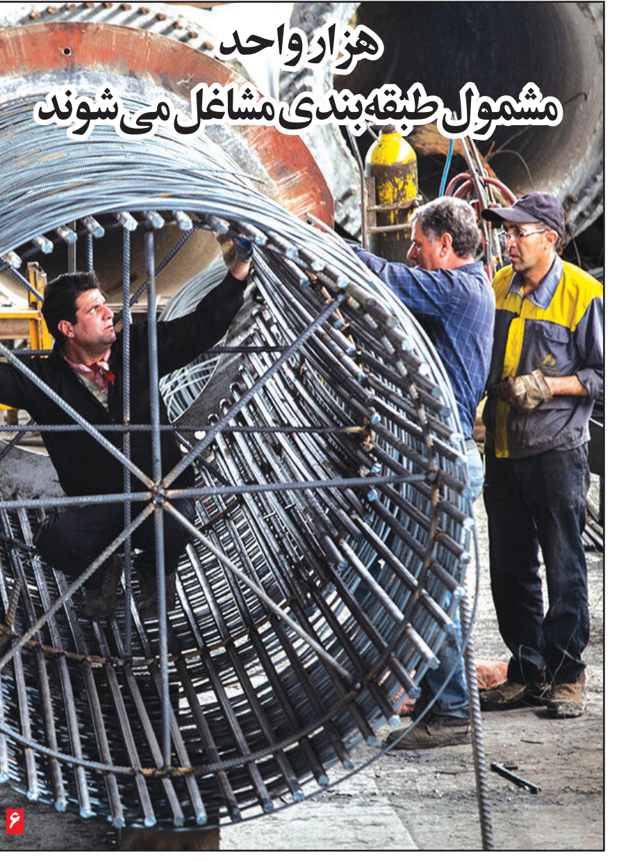
هزار واحد مشمول طبقه‌بندی مشاغل می‌شوند در این شماره می‌خوانید: ۲ منابع افزایش حقوق بازنشستگان مشخص شد ۳ بازی طولانی در خواست اضافه حقوق ۴ تدوین برنامه ملی کاهش حوادث جاده‌ای ۵ «وانکا» مخاطبان خود را پیدا کرد ۶ اونا:ا: همه چیز موقتی است ۸ پاسخ به یک شبهه تقویمی

معاون اول رئیس جمهور با تأکید بر ضرورت استفاده از روش‌ها و مکانیزم‌های جدید تأمین مالی برای سرمایه‌گذاری در استان‌ها به گزارش پیام آشنا، محمد مخبر دیروز در نشست با استانداران سراسر کشور با موضوع مهار تورم و رشد تولید، ضمن تبیین اولویت‌ها و برنامه‌های اصلی دولت برای کنترل تورم در ماه‌های پایانی سال، گزارش اقدامات استانداران در خصوص جلسه گذشته را دریافت کرد.