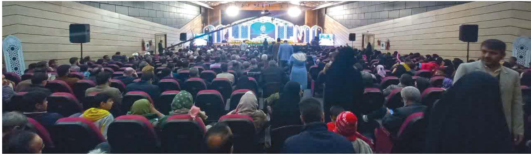
علی اصغر خسروی