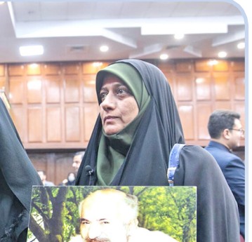
دادگاه رسیدگی به اتهامات گروهک تروریستی منافقین

در ۸ ماهه سال جاری باری بر ۱۳ تن شمش طلا به ارزش ۸۳۳ میلیون دلار از راه گمرکات کشور وارد شده است. بر اساس اعلام گمرک ایران، واردات شمش طلا با اختصاص ۱،۹۷ درصد از ارزش کل واردات کشور در ۸ ماهه سال جاری رتبه ششم اقلام عمده کالاهای وارداتی کشور را به خود اختصاص داد.