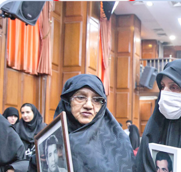
دادگاه رسیدگی به اتهامات گروهک تروریستی منافقین

در ۸ ماهه سال جاری باری بر ۱۳ تن شمش طلا به ارزش ۸۳۳ میلیون دلار از راه گمرکات کشور وارد شده است. بر اساس اعلام گمرک ایران، واردات شمش طلا با اختصاص ۱،۹۷ درصد از ارزش کل واردات کشور در ۸ ماهه سال جاری رتبه ششم اقلام عمده کالاهای وارداتی کشور را به خود اختصاص داد.