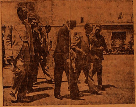
آقای وزیر امور خارجه ترکیه هنگام ملاحظه نمونه های مختلفه صنایع قدیمه

اگهی از تاریخ ۱۵ تیر ۱۳۱۶ بانگملی ایران اسکانسهای جدید خود را در تمام نقاط کشور بجریان خواهد گذاشت بنابراین میتوان اسکانسهای کهنه و پاراه فعلی را ببانکاراذه و با اسکانس های نومعاوضه نمود. هر موقع که تصمیم به جمع اوری کلیه اسکانس های فعلی گرفته شود طریق و ترتیب ان باتعمین سری هائی که از جریان خارج میشوند بوسیله اگهی با اطلاع عامه خواهد رسید بانک ملی ایران انتظار دارد که عموم اهالی در حفظ اسکانسهای جدید کمال دقت را بعمل آورده و حتی الامکان از تا کردن و هر گونه عملی که باعث خرابی و کهنگی اسکانس های مزبور بشود خودداری نمایند