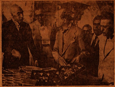
جناب آقای دکتر رشیدی اراکس وزیر امور خارجه ترکیه و همراهان هنگام ورود باداره کل صناعت برای بازدید کارخانه های صنایع قدیمه و جدیده