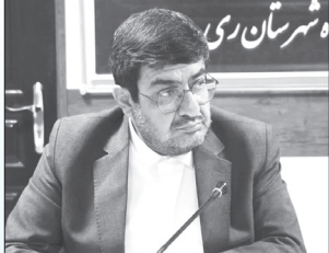
فرماندار ویژه شهرستان ری گفت: ارائه راهکار و پیشنهادهای علمی و عملی جهت رفع مشکلات از سوی جوانان می تواند به عنوان یک نقشه و راه حل منطقی توسط مدیران و تصمیم سازان مورد بهره‌برداری قرار گیرد.

به گزارش ایرنا، مهدی باب الحوائجی در جمع جوانان شهرستان ری، جوانان را مظهر امید، توانایی و قدرت در تفکر و تعقل دانست و اظهار داشت: تقاضای بنده از شما حضور تمام قد در موضوعات مختلف مدیریت شهرستان، با بهره گیری از نیروی فکر و اندیشه و استفاده از تجربه های مفید است. وی افزود: نکته مهمی که شما جوانان می بایست مدنظر قرار دهید خودداری از انتقاد و بیان کاستی ها و مشکلات به صورت صرف است. باب الحوائجی ادامه داد: وجود نیروهای جوان، توانمند، تحصیلکرده و متخصص یکی از مواهب بزرگ و مزیت های بی نظیر کشورمان است که در صورت بکارگیری صحیح و مناسب این نیروی عظیم، راه پیشرفت و شکوفایی ایران و اعتلای هرچه بیشتر نظام مقدس جمهوری اسلامی در سراسر جهان هموار و قابل دسترس می شود. معاون استاندار تهران با تأکید بر لزوم تشکیل نشست های هم اندیشی در قالب کمیته های تخصصی با حضور قشرهای مختلف جوانان، خاطر نشان کرد: استفاده از