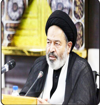
نماینده ولی فقیه در امور حج و زیارت: