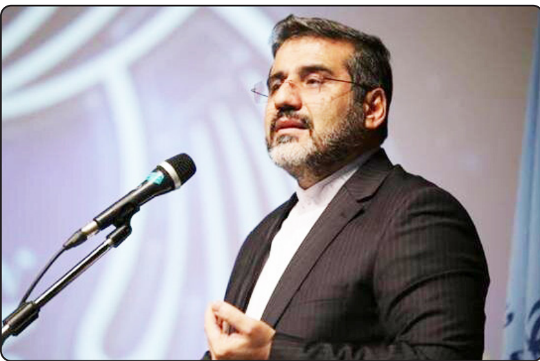
بودند و تا امروز حیات نهضت و استعلائی که رخ داد به دلیل حضور اصحاب قرآن و مسجد در

را باید ارتقای فعالیت‌های اجتماعی بر محوریت مسجد قرار دهیم. این فعالیت‌ها با الگویی که رهبر انقلاب و امام راحل تبیین کردند خیلی فاصله داریم. ما خلا داریم. اعداد و ارقام در مورد مساجد فعال به شدت نگران کننده است. اسماعیلی گفت: مساجد فعال، مساجدی نیستند که در آن سه وعده نماز جماعت برگزار شود که امروز بسیاری از مساجد ما همین کارکرد را هم ندارند.