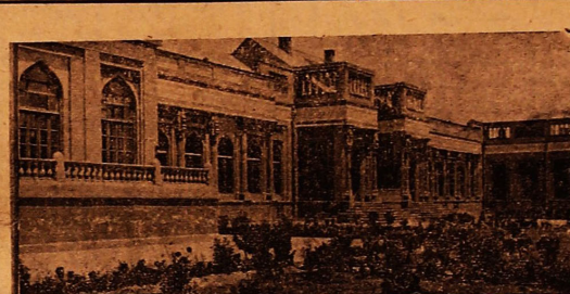
قسمتی از ساختمان بیمارستان شاه رضا در مشهد