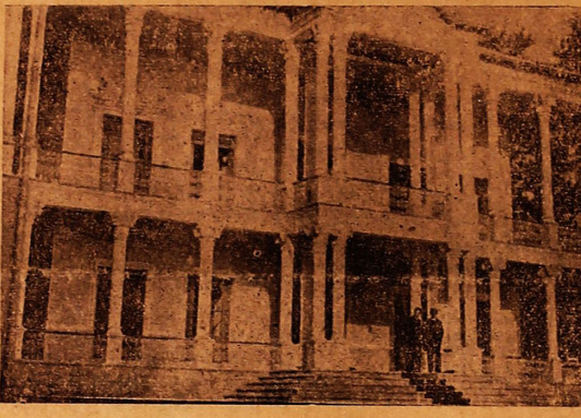
ساختمان مجلل وزیبا آسایشگاه شاه آباد