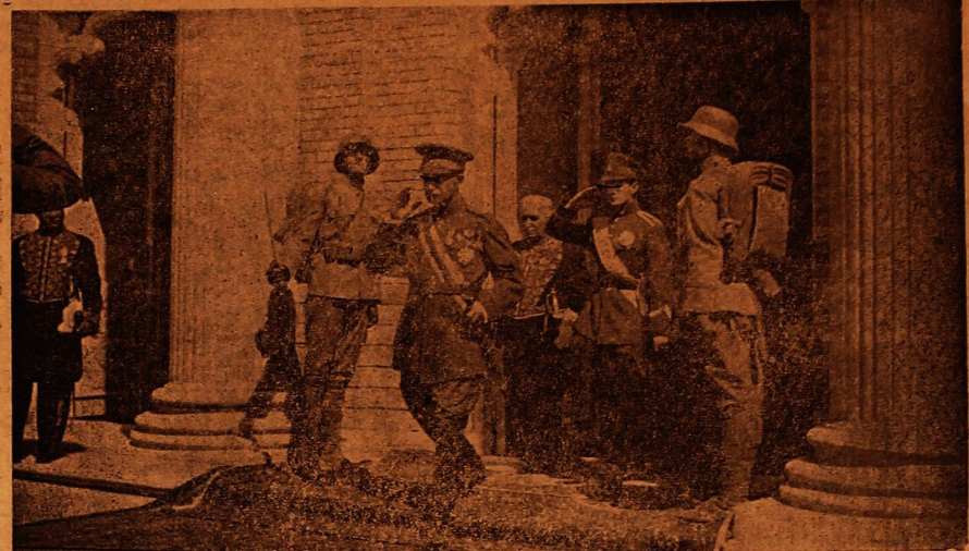
پس از اجرای مراسم آئین گشایش یازدهمین دوره تقنینیه