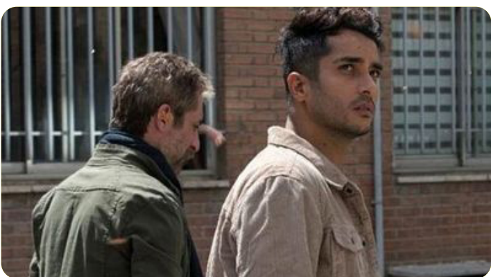
۹ «شهرک» بهترین فیلم فستیوال «ویتره» فرانسه شد