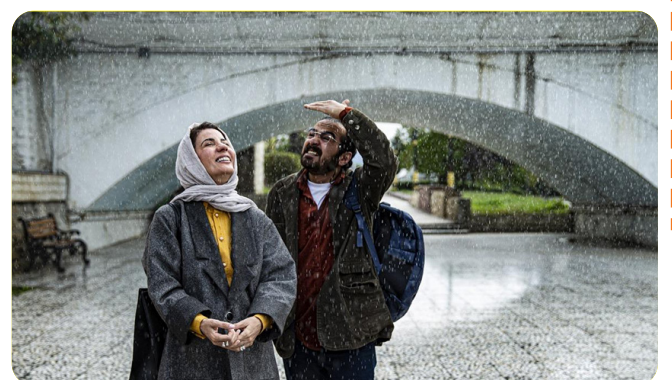
۱۴ نوستالژی یک نویسنده شکست خورده