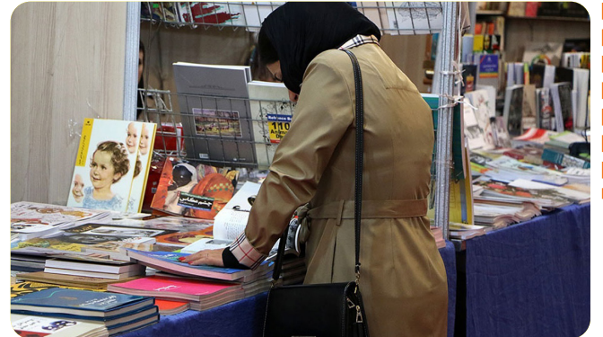
۵ کتاب؛ یار مهربان مردم در زندگی