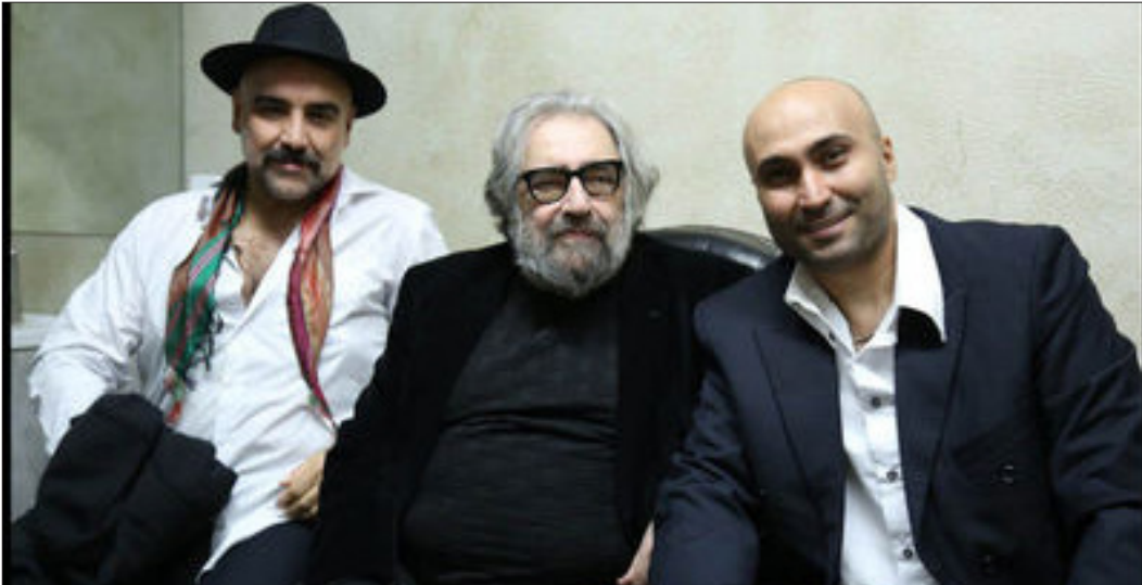
کیمیایی همچنین «بازنمایش قصه ترانه‌های ماندگار» را کاری نوشتارژیک و یادآور خاطرات گذشته دانست و از نقش آفرینی بازیگران این نمایش و اجرای ترانه‌های قدیمی توسط سالار عقیلی تمجید کرد.

سومین شب از اجرای پروژه «قصه ترانه‌های ماندگار» درحالی پیش روی مخاطبان قرار گرفت که مسعود کیمیایی کارگردان بزرگ سینمای ایران، مهمان ویژه این اثر نمایشی در تالار وحدت تهران بود.