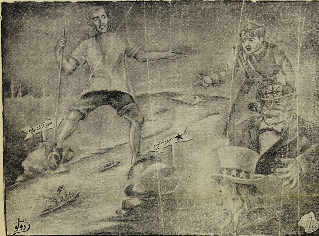
من بیپله یورم و الله