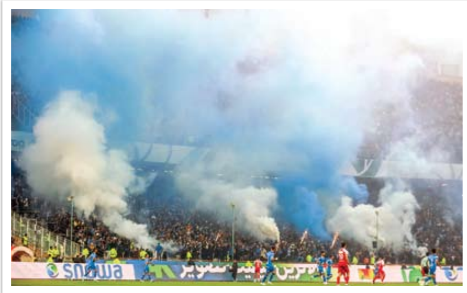
تیم فوتبال پرسپولیس در جریان بازی با تیم فوتبال استقلال

زمانی بود که اگر بازیکنی حاضر نبود به رسم ادب به بازیکن و مربی حریف دست دهد مورد مؤاخذه قرار می‌گرفت که حق ریختن ابروی تیم را ندارد و کادرفنی اولین نفراتی بودند که او را مؤظف به رعایت اصولی اخلاقی می‌کردند. همان‌ها که امروز کسی باید جلودار رفتارهای بی‌مهابا و تأسفبارشان باشد. حال آنکه رفتار و گفتار مربیان و کادرفنی تیم‌ها ارتباط مستقیم در ایجاد حاشیه و به تنش کشیدن بازی و سکوها دارد. اما آیا این مسئله برای آقایان اهمیتی دارد؟ بی‌شک پاسخ مثبت نخواهد بود که اگر بود آقایان به عنوان شخص اول تیم به خود اجازه نمی‌دادند با حرف‌های خلاف واقع یا تعابیر و حدسیات خود هواداران را تحریک کنند. آنهم قبل از آنکه دو تیم وارد میدان نبرد شده و سوت آغاز بازی به صدا درآید. ساد هاست که جو ورزشگاه را نیمکت تیم‌ها متشنج می‌کند. مربیان و بازیکنانی که گویی کوچکترین تصویری از اخلاق مداری در ذهنشان شکل نگرفته و