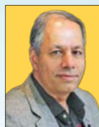
می توانیم حداقل