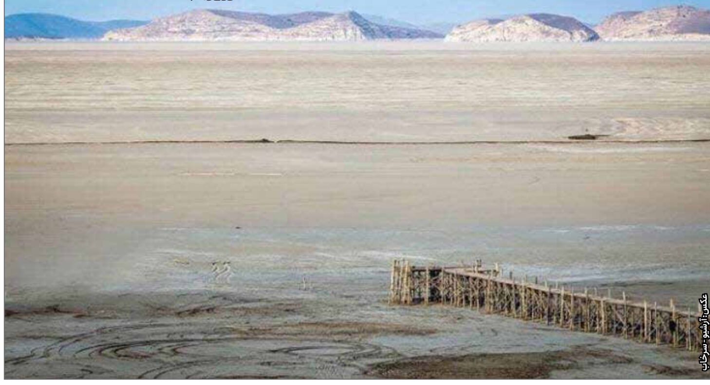
عکس: آرشبو سورخا