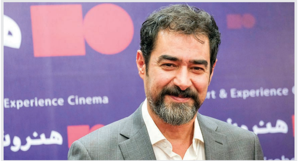
حسینی در مراسم خصوصی فیلم خودش یعنی «شهرزاد»