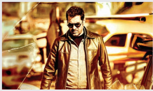
پوست شیر و یک تجربه موفق دیگر