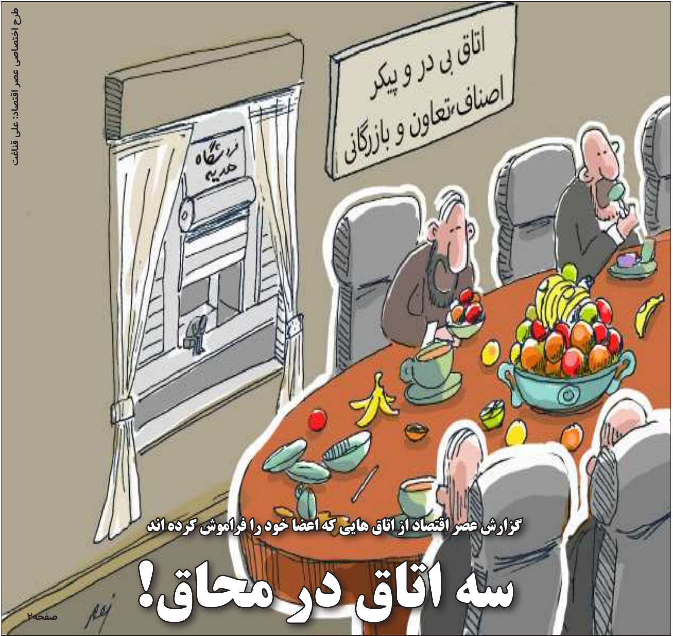
گزارش عصر اقتصاد از اتاق هایی که اعضا خود را فراموش کرده اند