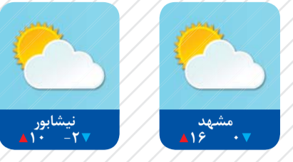
دگر روز یکشنبه

حدیث روز آداب‌ورسوم‌خوبش را به‌فرزندانتان تحمیل نکنید؛ زیرا آنان در روزگاری غیر از روزگار شما می‌زیند. امام‌علی(ع)، شرح نهج البلاغه