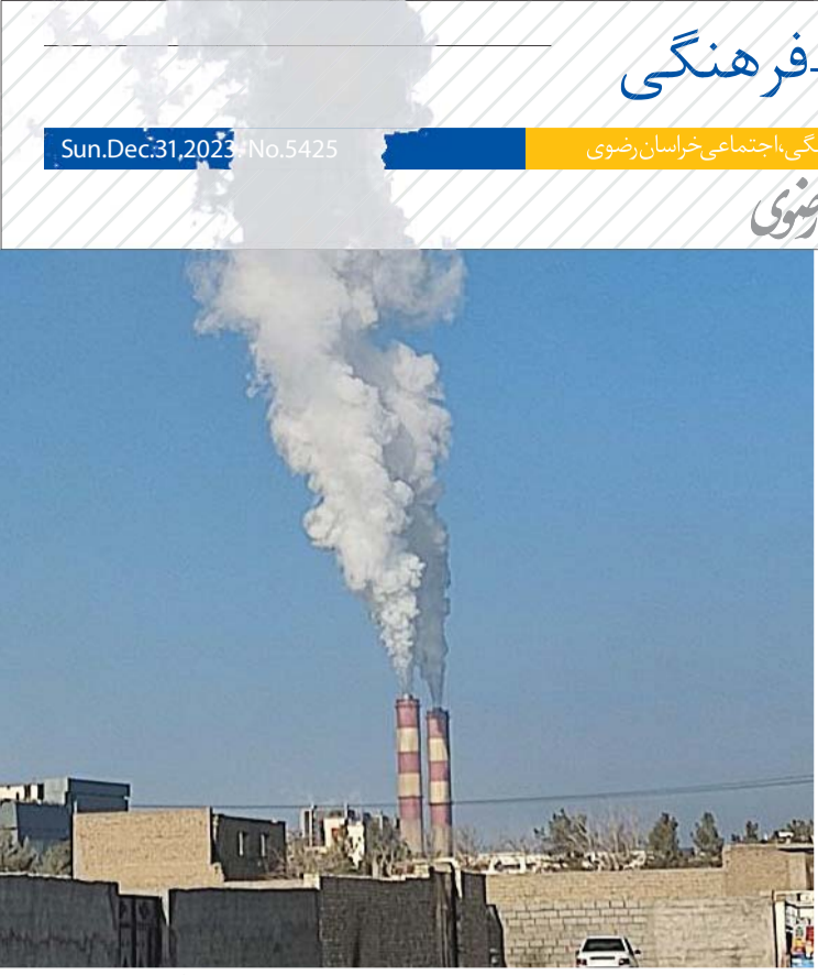
تصویری از مازوت سوزی نیروگاه توس در روز شنبه ۹ دی ماه

زیست استان نیز در گفت و گو با «خراسان» ضمن تایید این که گزارش نکر دن آمار مازوت سوزی توسط نیروگاه توس به دادستانی اعلام نشده است، در برابر مطالبه ما برای پیگیری جدی این موضوع گفت: «حنما اعلام می کنیم که مکاتبه جدیدی با نیروگاه توس انجام شود و موضوع را هم به دادستانی اعلام خواهیم کرد تا روند پیگیری به خوبی پیش برود. پس از آن در گزارشی با عنوان «نیروگاه توس؛ مازوت سوز و غیر پاسخگو!» در ۳۰ آذر، پیگیری موضوع را ادامه دادیم که در آن، معاون محیط زیست انسانی اداره کل حفاظت محیط زیست استان در باره اقدامات قضایی صورت گرفته برای توقف مازوت سوزی اظهار کرد: