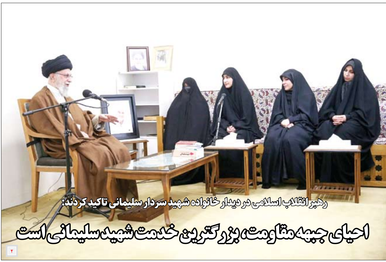
رئیس هیئت مدیره بانک مرکزی، محمدباقر قزوینی، در دیدار خانوادگی شهید سردار سلیمانی تأکید کردند:

احیای چپه مقاومت، بزرگترین خدمت شهید سلیمانی است