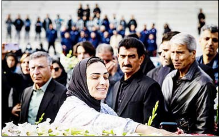
تشییع پیکر «ملیکا محمدی» بازیکن تیم ملی فوتبال ایران