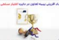
نمای آفرینی بیمه تعاون در دایره اعتبار سنجی

«کدام برند؟ کدام شرکت؟ کدام موسسه؟ کدام سرمایه‌گذاری؟ کدام خدمات؟ و…» با توجه به گستردگی و پیچیده شدن مناسبت‌های زندگی کلمه «کدام» یکی از اصلی‌ترین پرسش‌های افراد برای انتخاب انواع کالا و خدمات از میان میلیون‌ها نام است.به گزارش تجارت به نقل از روابط عمومی بیمه تعاون، سردرگمی در انتخاب که گاه دامنه وسیعتری پیدا کرده و از دایره‌ارزیابی افراد کنار گذاشته می‌شود، در بیشتر موارد با تضمین و مهر تأیید شرکت‌های رتبه‌بندی اعتباری به عنوان مرجع معتبر واصلح پایان می‌یابد، رویداد مهمی که در میان شرکت‌های بیمه‌ای تنها در بیمه تعاون رخ داده و انتخاب این شرکت را برای بیمه‌گذاران و سهامداران با چشم‌های بسته ممکن کرده‌است.