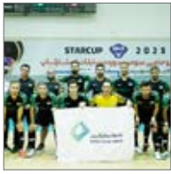
تیم فوتبال استار کاپ در حال جشن گرفتن

خود را با برتری پشت سر گذاشته به مرحله نهایی برسد. تیم بانک در نخستین بازی خود به مصاف تیم اکواستار رفت و این تیم را با نتیجه ۹ بر صفر شکست داد.دومین بازی را مقابل تیم تیمسی انجام و با پیروزی ۴ بر یک تیم کارآفرین ادامه یافت.همچنین تیم فوتسال بانک کارآفرین در سومین بازی خود به مصاف تیم شرکت سرمایه گذاری قارابی رفت و در یک بازی بسیار نزدیک و زیبا توانست با نتیجه ۶ بر ۲ پیروز میدان شودو در ادامه مسابقات جام استار کاپ تیم بانک کارآفرین در مقابل تیم کالیس با نتیجه یک بر صفر پیروز میدان شد و به مرحله نیمه نهایی رفت.در مسابقه نیم نهایی تیم بانک کارآفرین مقابل کرمان موتور به میدان رفت و با نتیجه پر گل ۱۰ بر ۴ به مرحله فینال راه یافت.