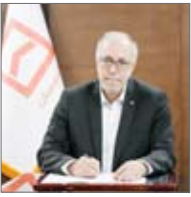
وزیر راه و شهرسازی در مراسم افتتاح پروژه

تامین مالی ساخت بیش از ۳۱۳ هزار واحد مسکونی در طرح نهضت ملی