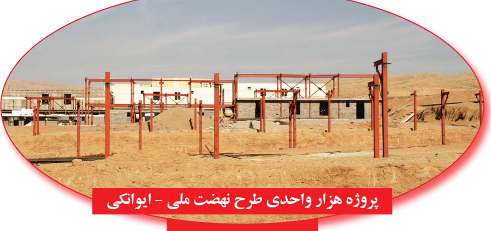
پروژه هزار واحدی طرح نهضت ملی - ایوانکی