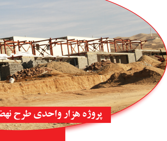
پروژه هزار واحدی طرح نهضت ملی - ایوانکی

۱- احداث ۲۴۰ واحدی رباط کریم در استان تهران (طرح نهضت ملی) به کارفرمای اداره کل راه و شهرسازی استان تهران ۲- احداث یکپار واحد ویلا در ایوانکی استان سمنان به کارفرمای شرکت شهر جدید ایوانکی که واحدهای بسیار خوش‌ساختی می‌باشند که ۱۹۰ واحد به صورت دوبلکس طراحی شده و مابقی به صورت یک طبقه هستند (طرح نهضت ملی)