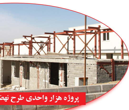
پروژه هزار واحدی طرح نهضت ملی - ایوانکی

۱- احداث ۲۴۰ واحدی رباط کریم در استان تهران (طرح نهضت ملی) به کارفرمای اداره کل راه و شهرسازی استان تهران ۲- احداث یکپار واحد ویلا در ایوانکی استان سمنان به کارفرمای شرکت شهر جدید ایوانکی که واحدهای بسیار خوش‌ساختی می‌باشند که ۱۹۰ واحد به صورت دوبلکس طراحی شده و مابقی به صورت یک طبقه هستند (طرح نهضت ملی)