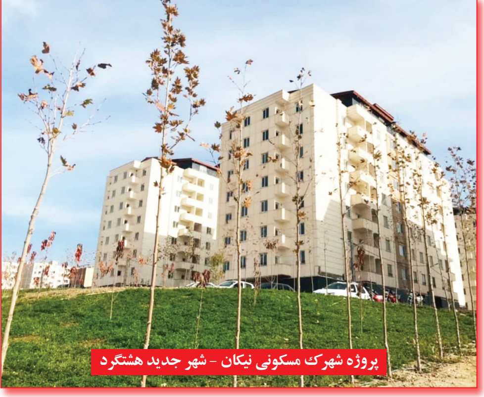
پروژه شهرک مسکونی نیکان - شهر جدید هشتگرد