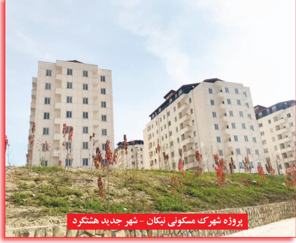
پروژه شهرک مسکونی نیکان - شهر جدید هشتگرد