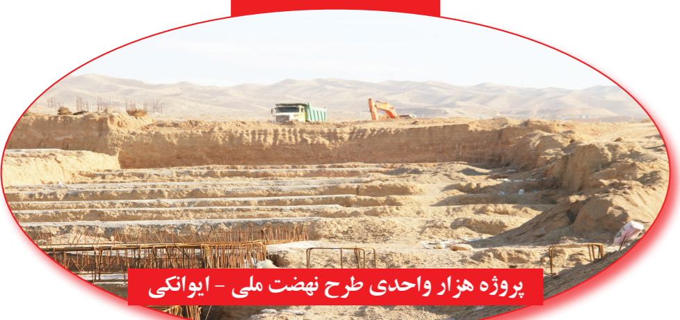
پروژه هزار واحدی طرح نهضت ملی - ایوانکی

بسیار نگاهت بانک عامل (خصوصاً بانک مسکن) تقطعه عطفی را با محسوب می‌شود و امیدواریم هر چه سریعتر بتوانیم مسکن هموطنان عزیز را در پروژه‌های نهضت ملی به مرحله بهره‌برداری رسانیم. سخن پایانی ما بعنوان سرباز دولت در حوزه عمرانی فعالیت می‌نماییم و سرباز نیاز به پشتیبانی و حمایت دارد تا بتواند پیروز میدان باشد! برای پیروزی در عرصه‌های عمرانی و ارائه خدمتی که شایسته مردم عزیزمان می‌باشد نیاز به کمک داریم، هر چند که حمایت صورت می‌گیرد و دولت محترم در کنار ما هستند ولی ما برای ارائه خدمت بیشتر انتظارات بیشتری داریم که امیدواریم با حمایت جدی‌تر و هماهنگی نگاهت دستگانه‌های خدمات‌رسان کیفیت پروژه‌ها و سرعت اجرا را به حداکثر برسانیم.