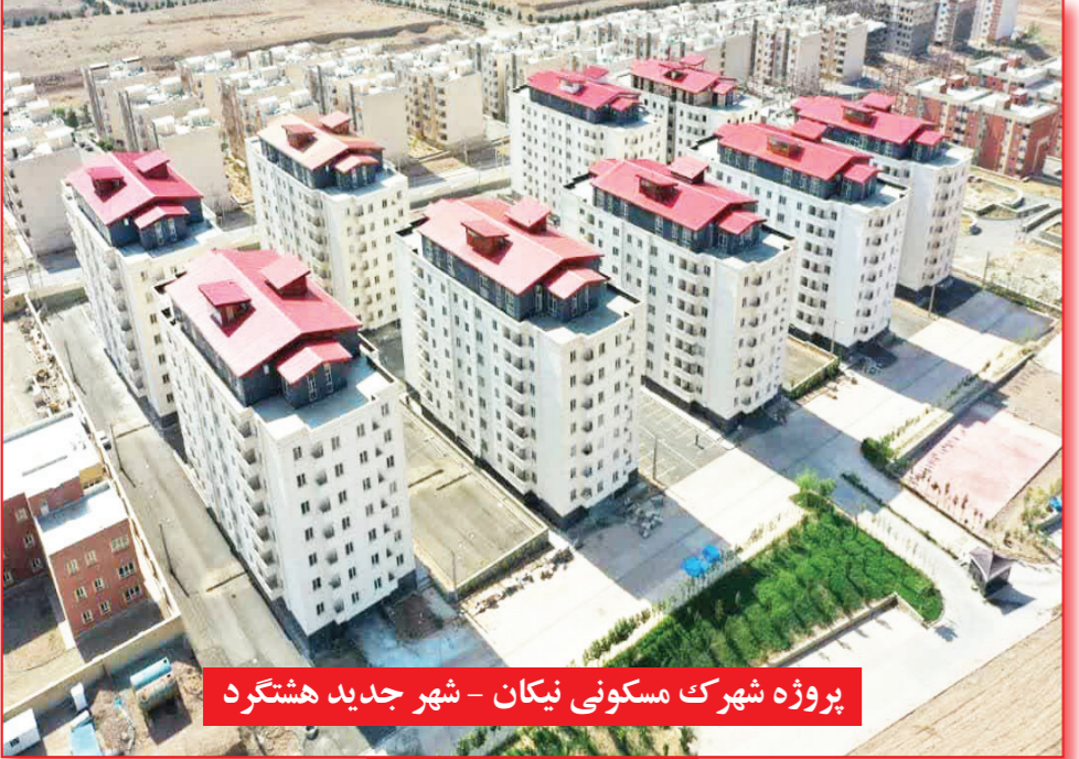
پروژه شهرک مسکونی نیکان - شهر جدید هشتگرد