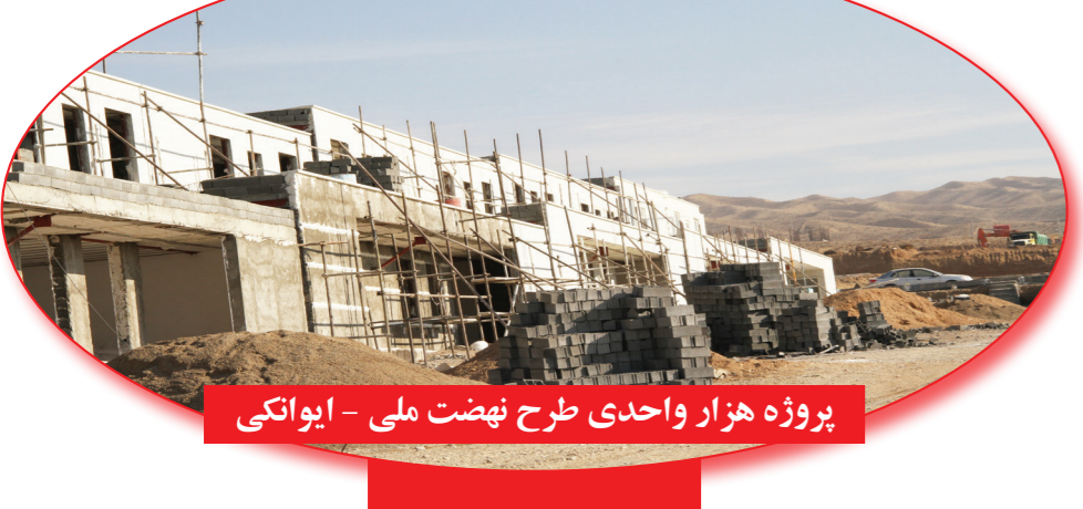
پروژه هزار واحدی طرح نهضت ملی - ایوانکی

تشکر و قدردانی وظیفه می‌دانم از تمامی مسئولان محترم که دغدغه خدمت به مردم عزیز کشور را دارند و در این راه تلاش می‌نمایند. قدردانی صمیمانه‌ای داشته باشیم و در خاتمه قلدوران حمایت‌ها و همراهی‌های مدیران محترم شعب بانک مسکن در استان‌های البرز، مازندران، تهران و سمنان، خانواده محترم برتلاش و همراه خود و پرسنل شریف و سختکوش شرکت هومیان بنا باشم که ما را در اجرای پروژه‌های عام‌المنفعه یاری می‌نمایند.